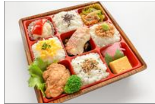
【お茶なし】ひだまり-赤魚の西京焼きと若鶏のからあげ-