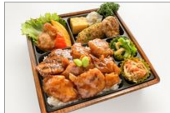
【お茶なし】かさね-鶏肉の炭火焼き-