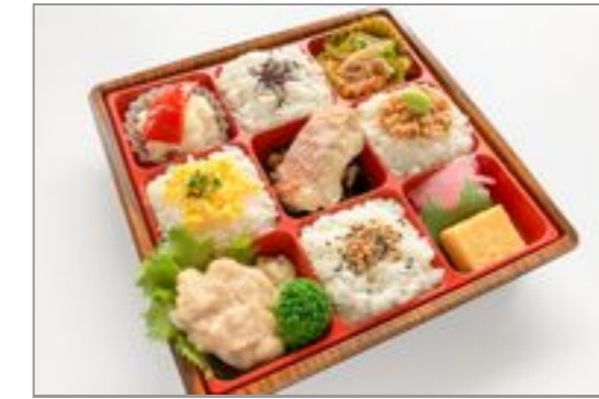
【お茶なし】ひだまり-赤魚の西京焼きと鶏肉の塩こうじ焼き-