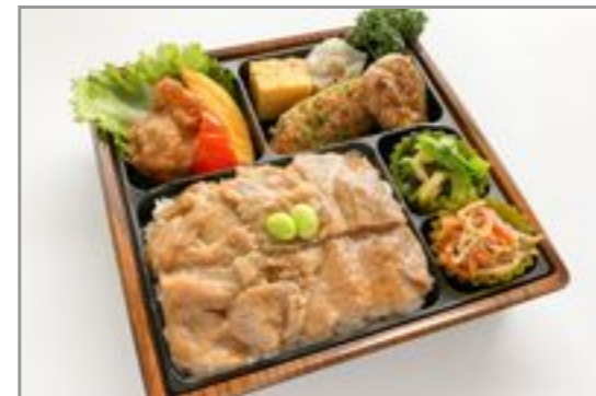
【お茶なし】かさね-もち豚のしょうが焼き-