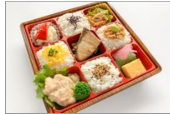
【お茶なし】ひだまり-ぶりの照り焼きと鶏肉の塩こうじ焼き-