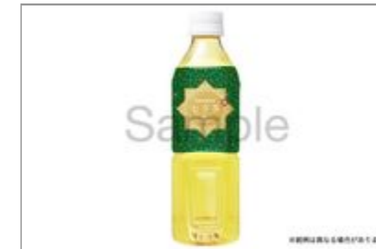
緑茶(500ml ペットボトル)