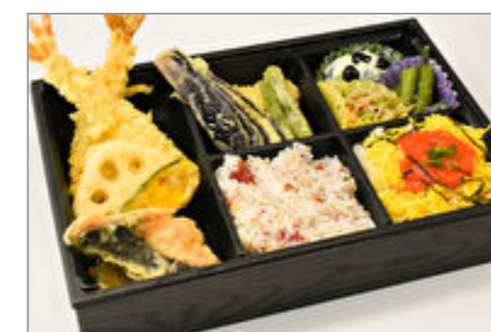
おもてなし弁当(彩)