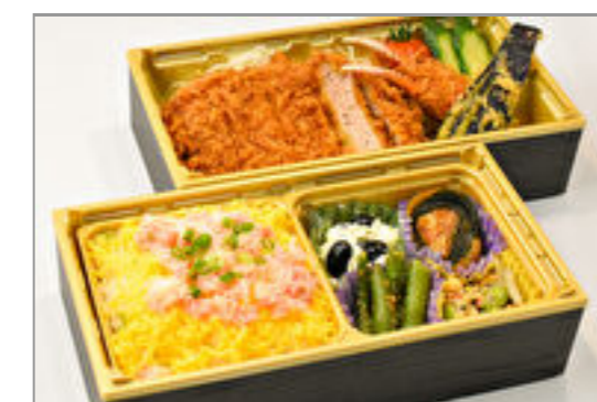
おもてなし弁当(極)