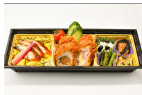
おもてなし弁当(輝)