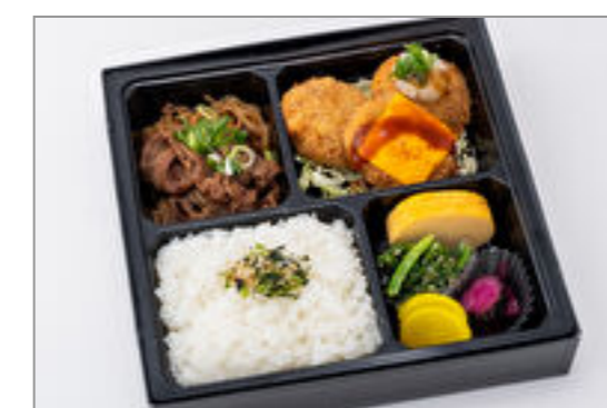
牛タン入りメンチカツとすき焼き弁当