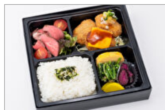
牛タン入りメンチカツとローストビーフサラダ弁当