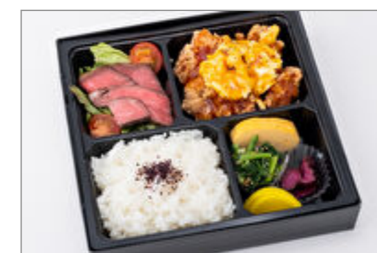
特製チキン南蛮とローストビーフサラダ弁当