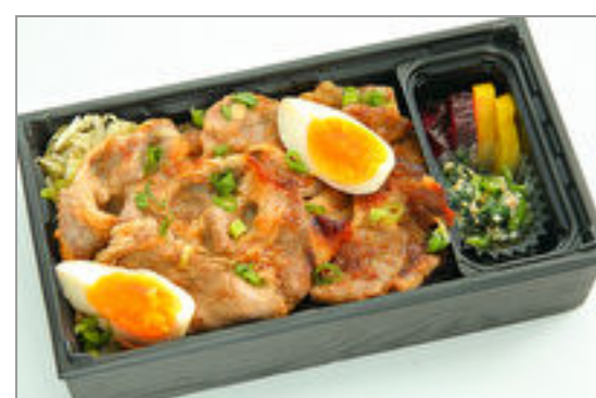
京の都もち豚ステーキ重

商品によっては、注文条件やオプション・サービス等がございますので、詳しくは WEB でご確認ください。