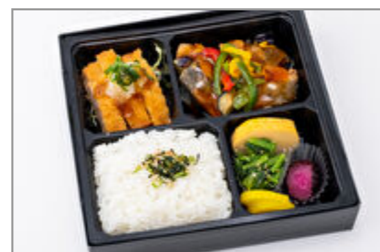
サバの竜田揚げ甘酢餡かけとトンカツ弁当