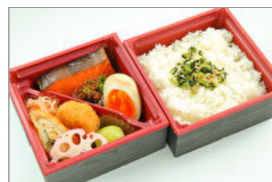
焼きトロサーモンの彩り二段