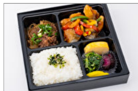
サバの竜田揚げ甘酢餡かけとすき焼き弁当