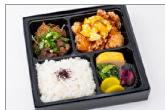
特製チキン南蛮とすき焼き弁当