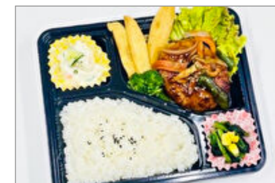
煮込みハンバーグ弁当