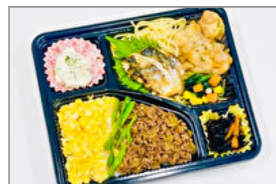
【日替り】お魚とお肉のそぼろ弁当