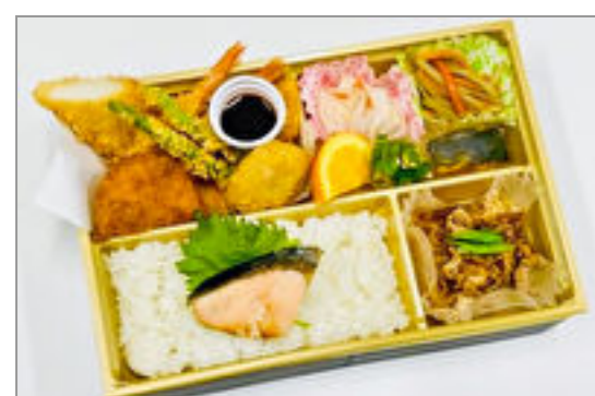
ミックスフライ御膳