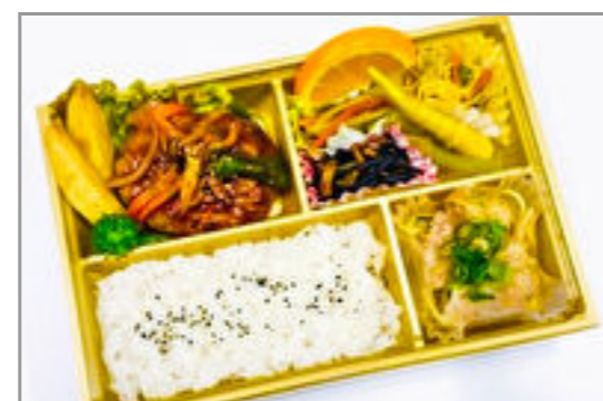
煮込みハンバーグ御膳