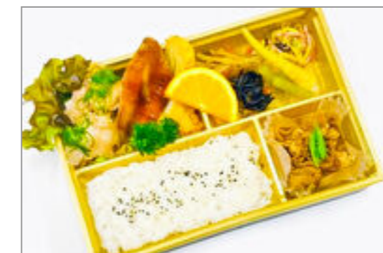
魚の照り焼き御膳