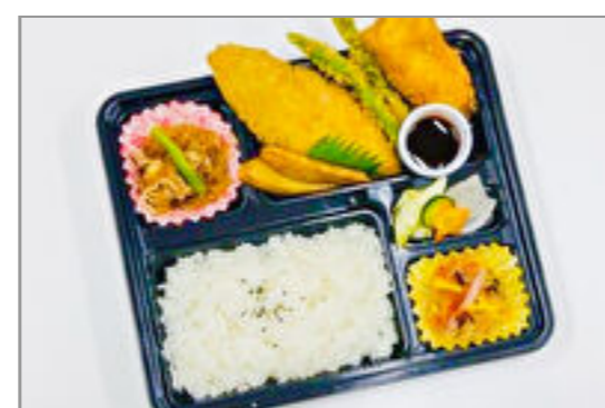
ミックスフライ弁当