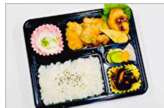
鶏の照り焼き弁当