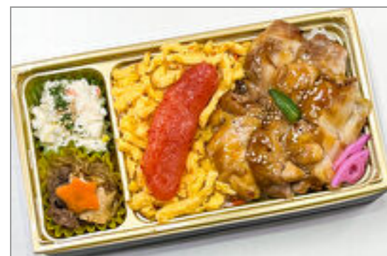
明太子と鶏の照り焼き御膳