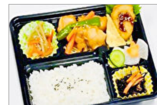
鶏の辛味噌焼き弁当