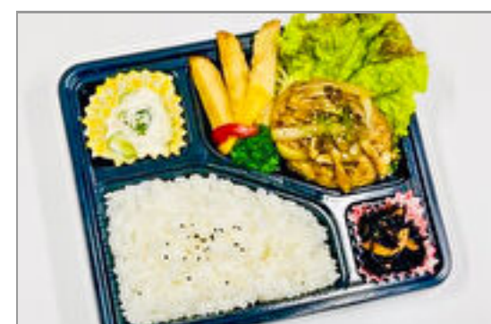
和風ハンバーグ弁当