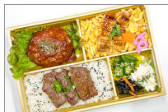
牛焼肉と穴子ちらしのまんぶく御膳