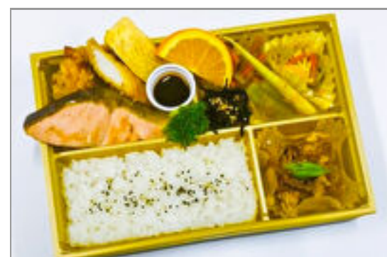
焼き鮭とフライ御膳