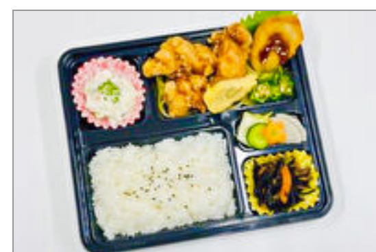
鶏の塩唐揚げ弁当

商品によっては、注文条件やオプション・サービス等がございますので、詳しくは WEB でご確認ください。