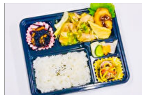
鶏のねぎ塩焼き弁当