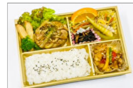
和風ハンバーグ御膳