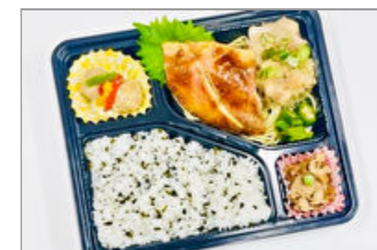
【日替り】お魚とお肉のわかめご飯弁当