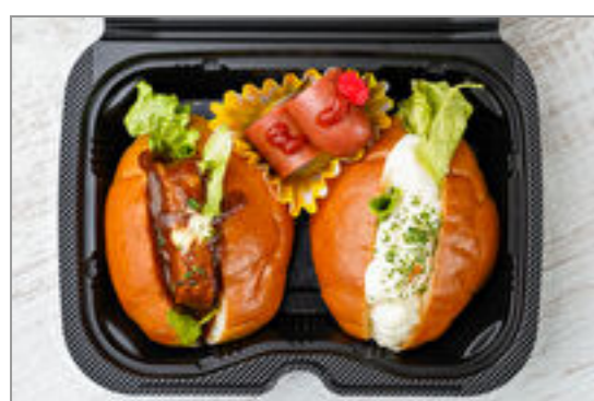
ハンバーグ&ポテトサラダのロールパンボックス【グリルフランク】

商品によっては、注文条件やオプション・サービス等がございますので、詳しくはWEBでご確認ください。