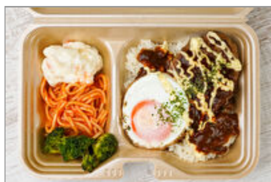
自家製牛すじ煮込みハンバーグのロコモコ