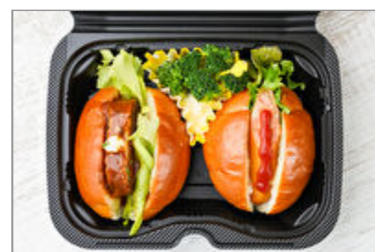
ハンバーグ&ホットドッグのロールパンボックス【焼きブロッコリー】