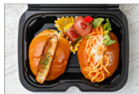
ミートコロッケ&ナポリタンのロールパンボックス【グリルフランク】