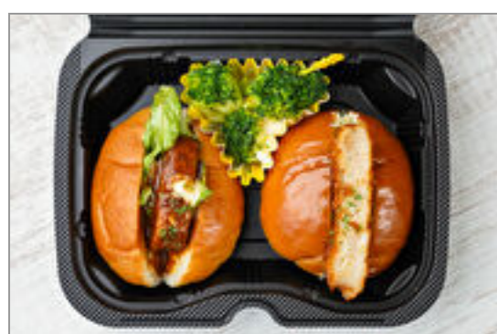
ハンバーグ&コロッケのロールパンボックス【焼きブロッコリー】