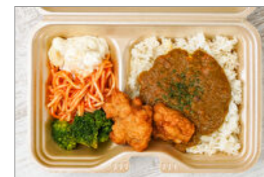
具材ゴロゴロやみつぎキーマカレーと唐揚げボックス