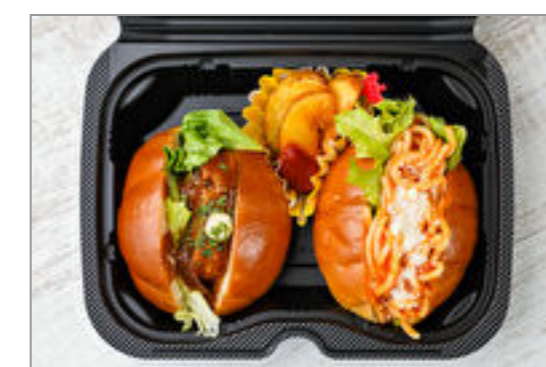
ハンバーグ&ナポリタンのロールパンボックス【フライドポテト】