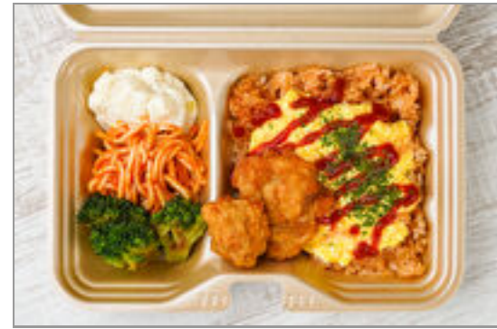
とろとろタマゴのオムライスと唐揚げボックス