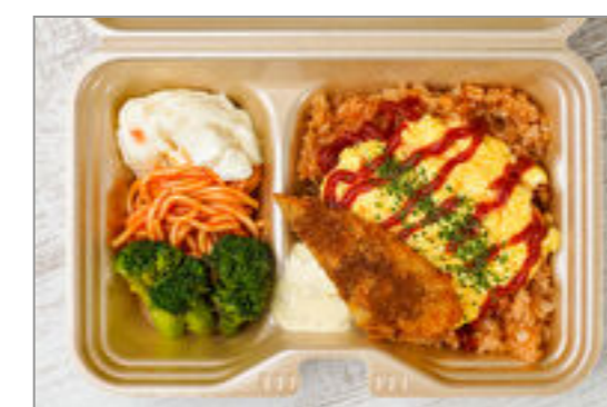
とろとろタマゴのオムライスと白身魚フライのタルタルソース添え