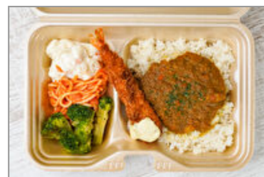
具材ゴロゴロやみつぎキーマカレーとエビフライのタルタルソース添え