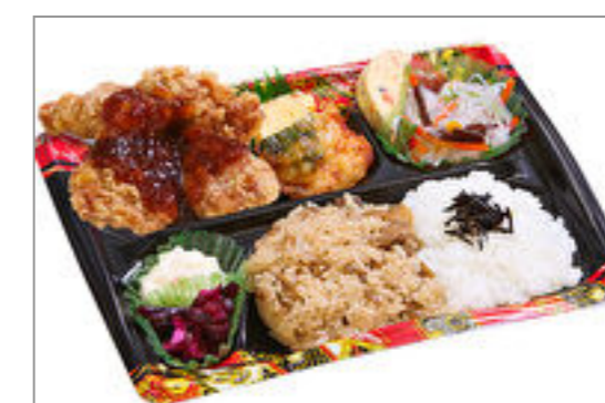
隅田川 おろし唐揚げ