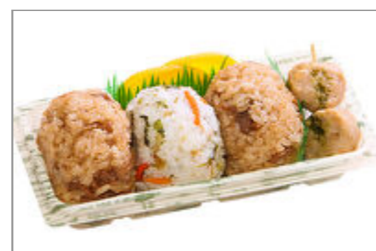
おにぎり3個とつくね串 815円(税込880円) / 品番:TKRP017