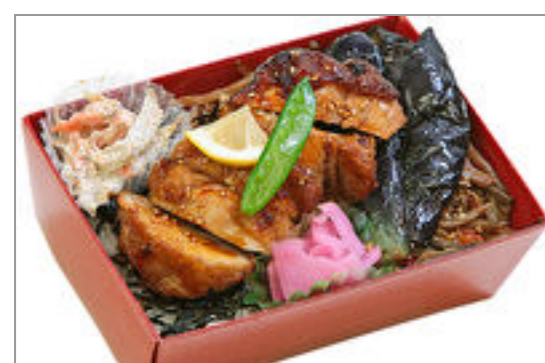
鶏照重(重箱) 1,334円(税込1,440円) / 品番:TKRP019