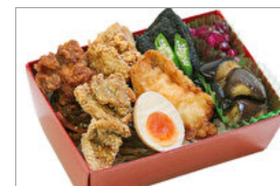
五宝唐揚重(重箱) 1,334円(税込1,440円) / 品番:TKRP021