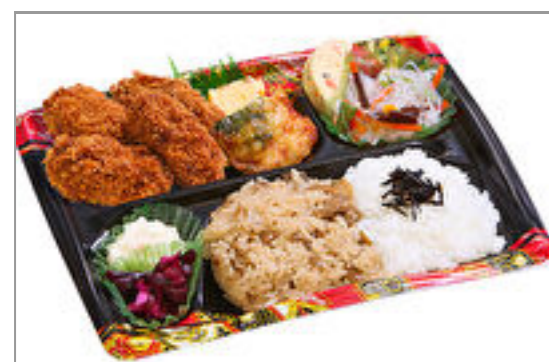
隅田川 カキフライ