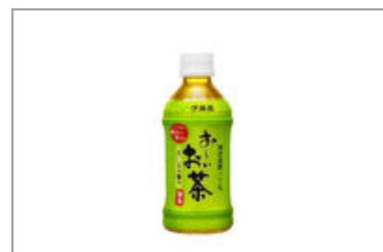
お〜いお茶(350ml ペットボトル)