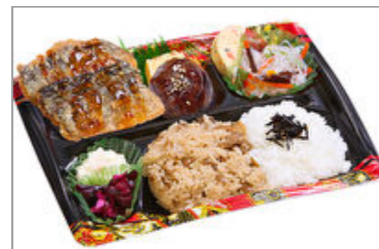
隅田川 サンマ南蛮ソース