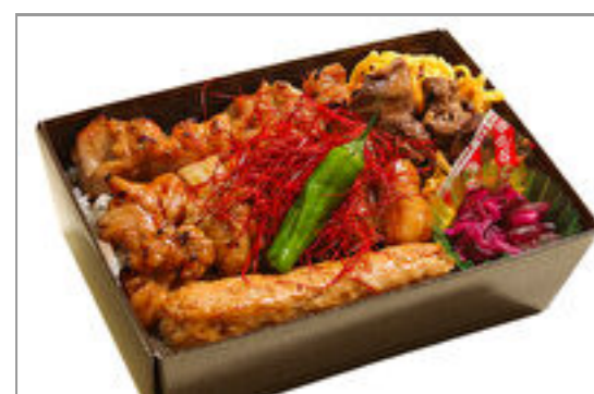
焼とり重(重箱) 1,334円(税込1,440円) / 品番:TKRP022