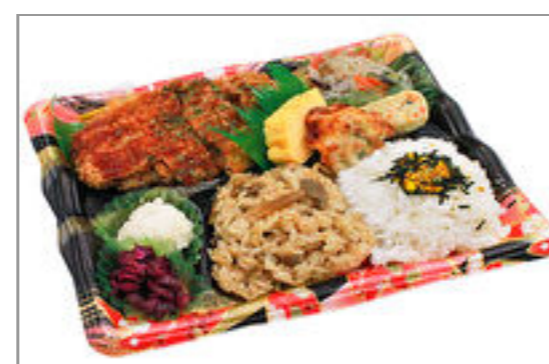
隅田川 チキンカツ