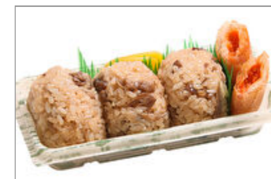
おにぎり3個と春巻 815円(税込880円) / 品番:TKRP015