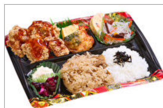
隅田川 甘酢唐揚げ