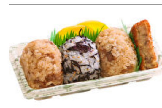
おにぎり3個とすき焼風コロッケ 815円(税込880円) / 品番:TKRP018