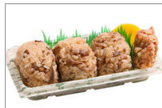
おにぎり3個と唐揚げ 815円(税込880円) / 品番:TKRP014