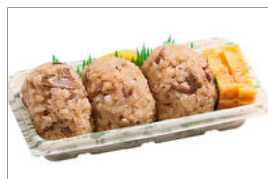
おにぎり3個と玉子焼き 815円(税込880円) / 品番:TKRP016