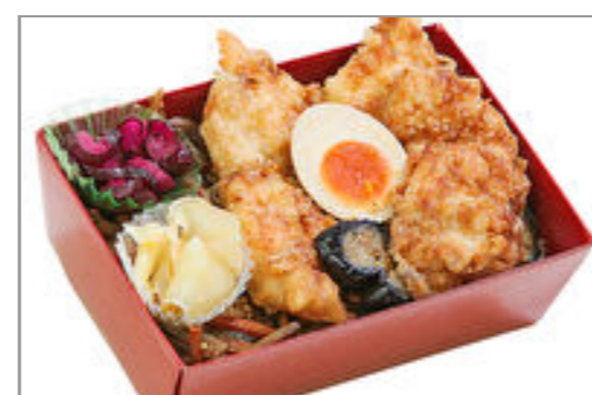
鶏天重(重箱) 1,334円(税込1,440円) / 品番:TKRP020