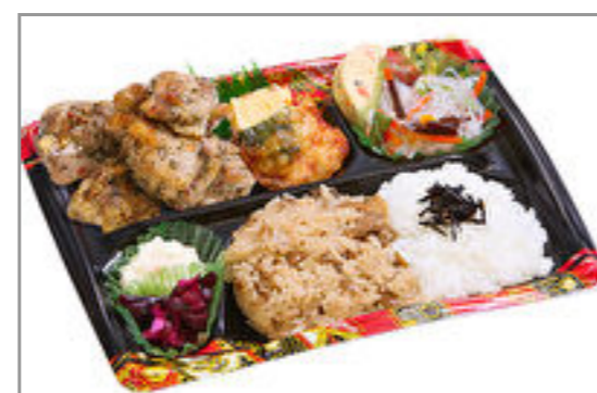
隅田川 チキンバジルソース