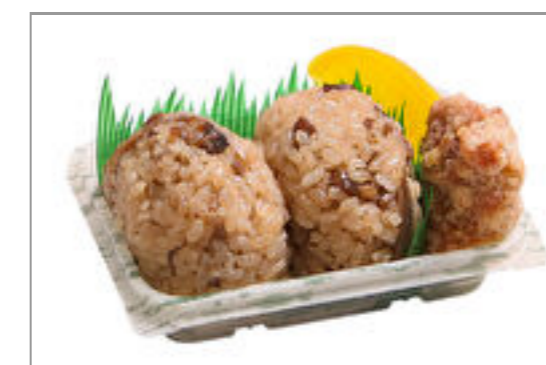
おにぎり2個と唐揚げ