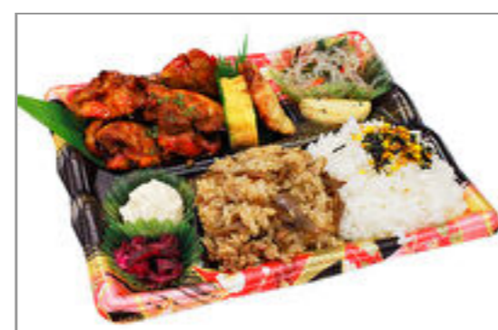
隅田川 タンドリーチキン