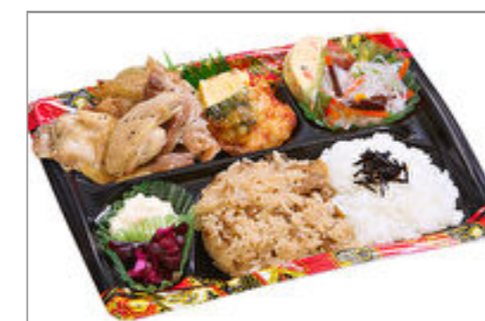
隅田川 鶏塩だれ焼き