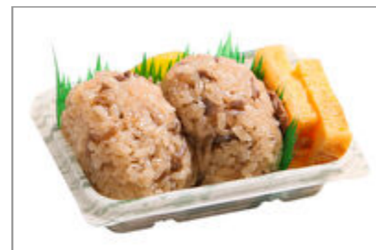
おにぎり2個と玉子焼き 612円(税込660円) / 品番:TKRP011