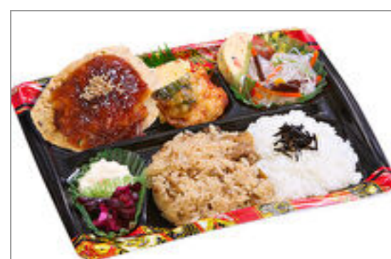
隅田川 豆腐ハンバーグ