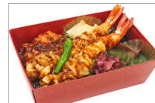
えび天重(重箱) 1,334円(税込1,440円) / 品番:TKRP024