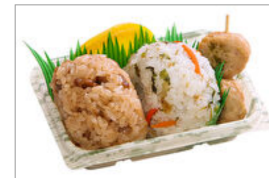
おにぎり2個とつくね串 612円(税込660円) / 品番:TKRP012