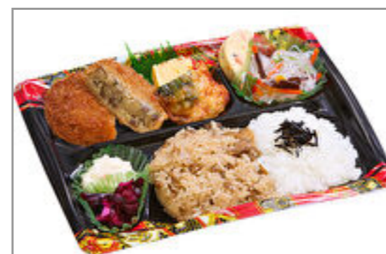
隅田川 すき焼風コロッケ