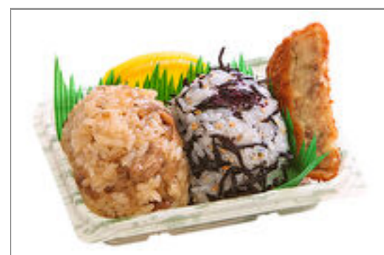
おにぎり2個とすき焼風コロッケ 612円(税込660円) / 品番:TKRP013