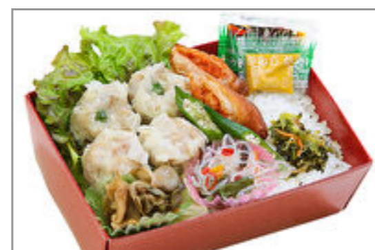
焼売重(重箱) 1,334円(税込1,440円) / 品番:TKRP023