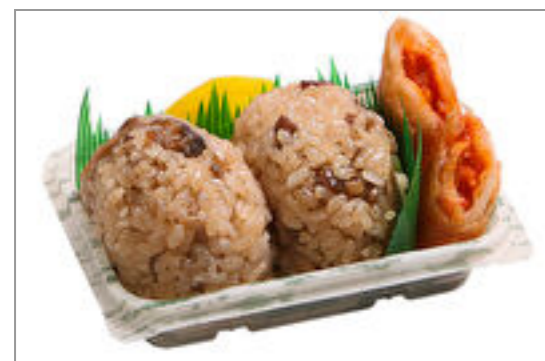
おにぎり2個と春巻 612円(税込660円) / 品番:TKRP010