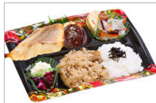
隅田川 赤魚西京焼き