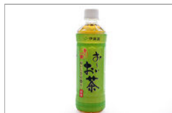
お〜いお茶(500ml ペットボトル)