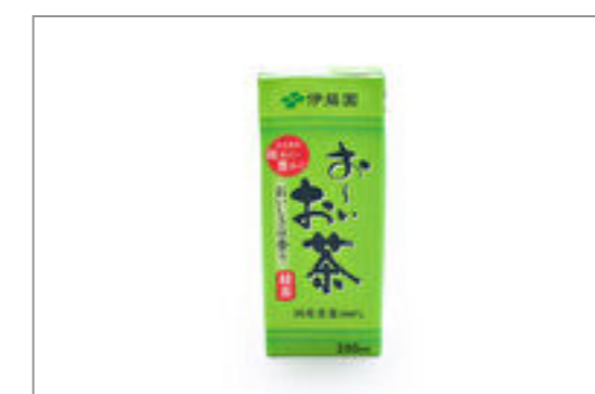
お〜いお茶(250ml 紙パック)