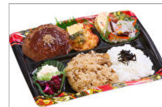
隅田川 ハンバーグおろしソース