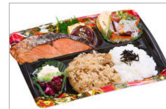
隅田川 鮭の塩焼き