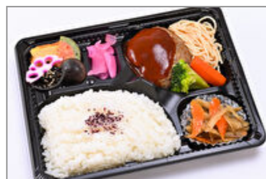
デミグラスハンバーグ弁当