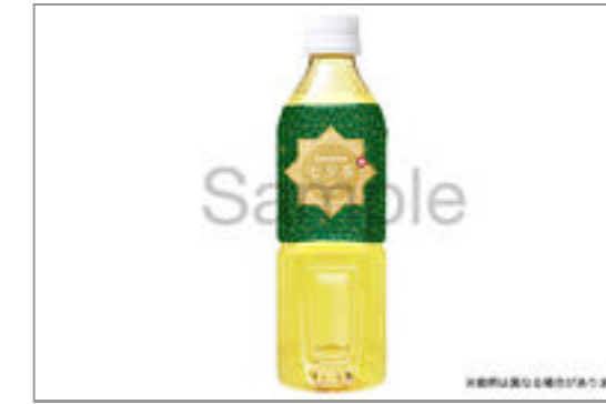
緑茶(500ml ペット ボトル)