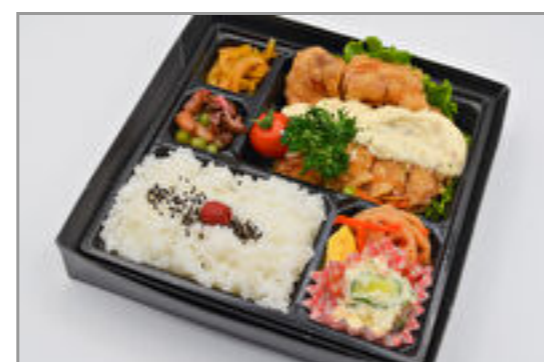
チキン南蛮弁当 899円(税込970円) / 品番:KNFD023