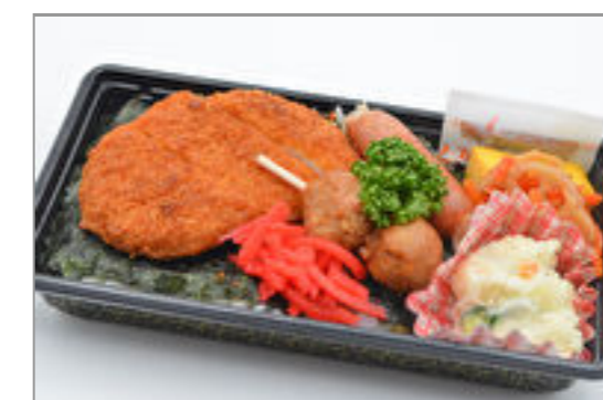
のり弁当C 556円(税込600円) / 品番:KNFD024