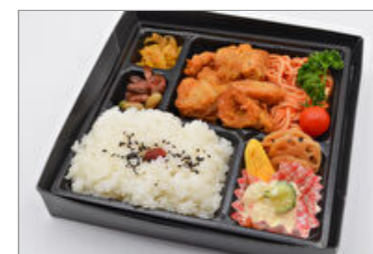
自家製鶏の唐揚げ弁当