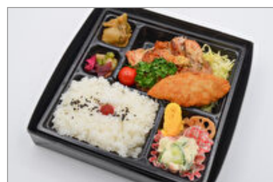
ガーリックチキン&白身フライ弁当 899円(税込970円) / 品番:KNFD019