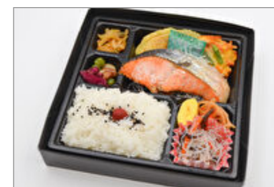
銀鮭の塩焼&野菜のかき揚げ弁当