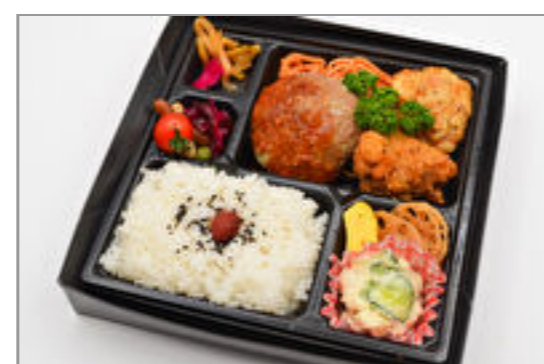
ハンバーグ&唐揚弁当 834円(税込900円) / 品番:KNFD017