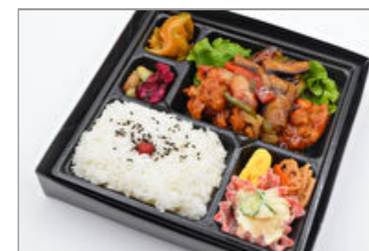
鶏の唐揚げ黒酢あんかけ弁当