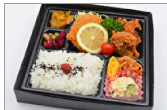
メンチカツ&鶏の唐揚弁当 788円(税込850円) / 品番:KNFD013