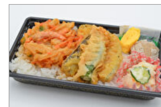
かき揚げ弁当 556円(税込600円) / 品番:KNFD021