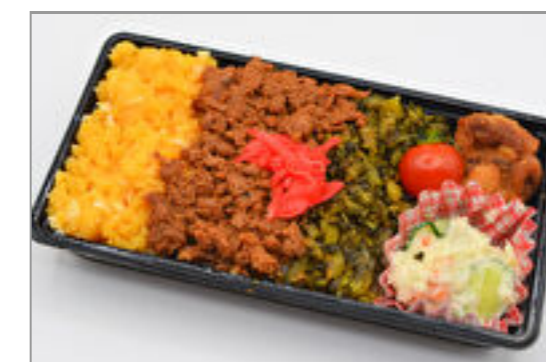
三色鶏そぼろ弁当 593円(税込640円) / 品番:KNFD015