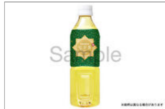
緑茶 (500ml ペットボトル)