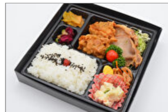
豚生姜焼き&唐揚弁当 797円(税込860円) / 品番:KNFD011