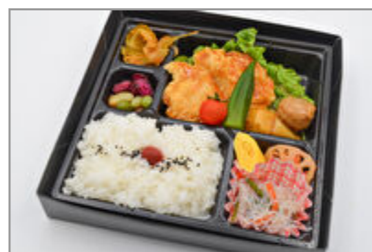
白身魚の揚げ煮弁当