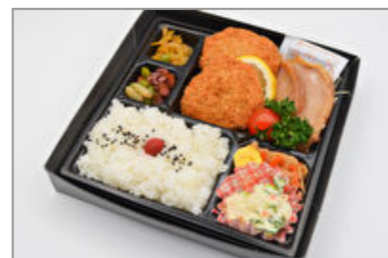
豚生姜焼き&ひれかつ弁当 871円(税込940円) / 品番:KNFD014