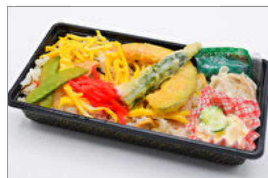
五目寿司弁当 500円(税込540円) / 品番:KNFD022