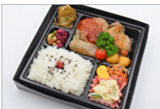
ミックスグリル弁当