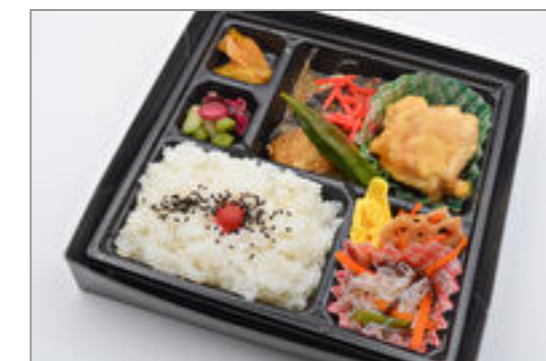
鯖の味噌煮&揚げ出し弁当 695円(税込750円) / 品番:KNFD012