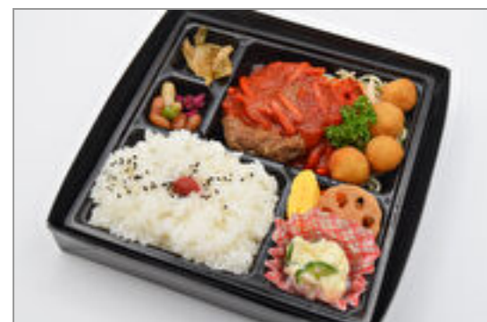
カマンベールハンバーグ弁当 852円(税込920円) / 品番:KNFD010