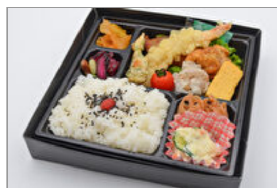
エビヤ 幕の内弁当