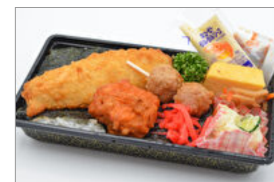
のり弁当B 500円(税込540円) / 品番:KNFD018