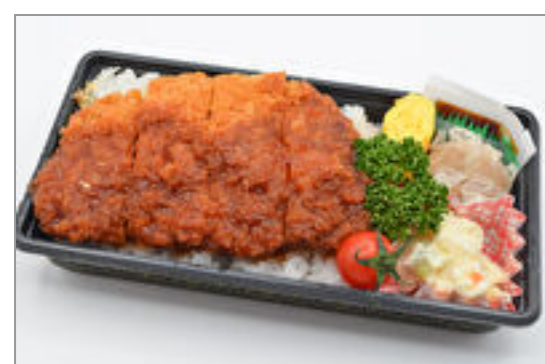
ソースかつ弁当 593円(税込640円) / 品番:KNFD016