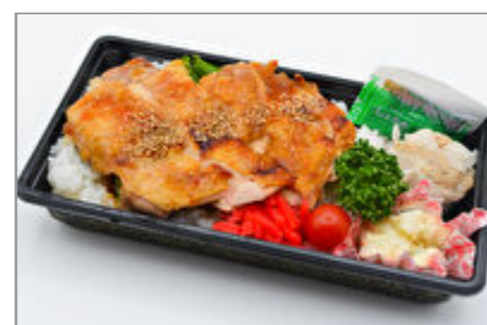
鶏の照焼弁当 649円(税込700円) / 品番:KNFD020