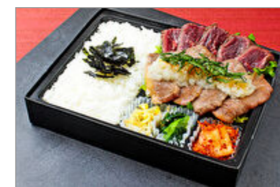
近江牛カルビと牛ハラミおろしポン酢弁当