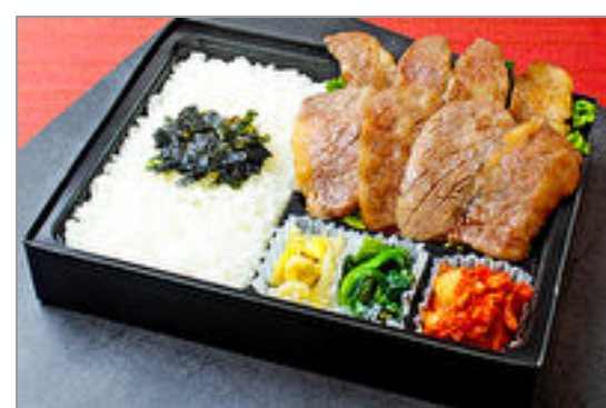
近江牛カルビ弁当

商品によっては、注文条件やオプション・サービス等がございますので、詳しくはWEBでご確認ください。