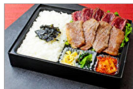
近江牛カルビと牛ハラミ弁当