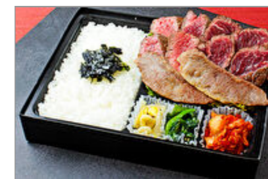
焼肉すだくの3種盛り(近江牛カルビ、牛ハラミ、シンタマステーキ)