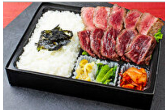
牛ハラミとやわらかシタマステーキ2種盛り弁当