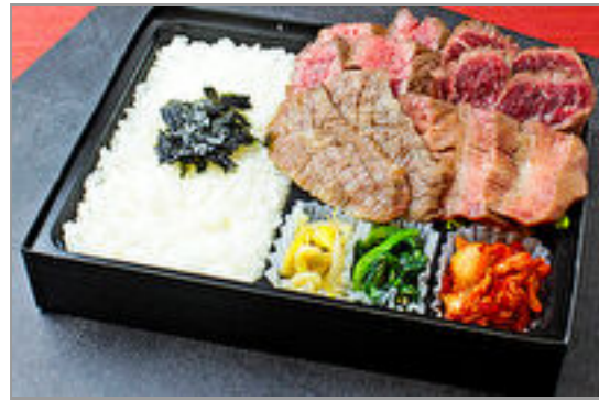
焼肉すだくの4種盛り(近江牛カルビ、牛たん、牛ハラミ、シタマステーキ)