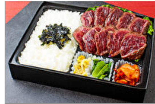
牛ハラミステーキ弁当