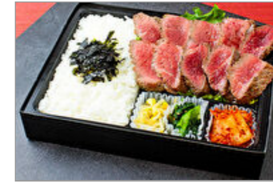
やわらかシタマステーキ弁当