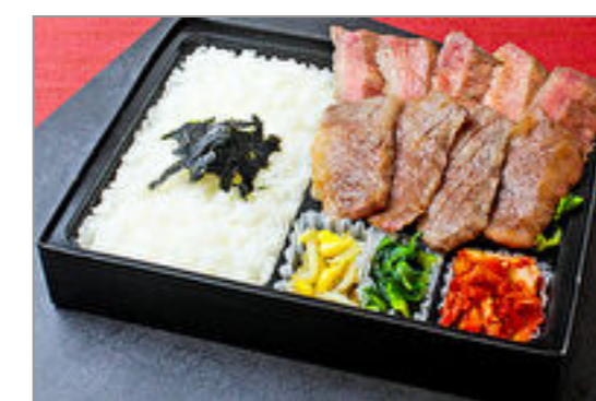
近江牛カルビと牛たん弁当