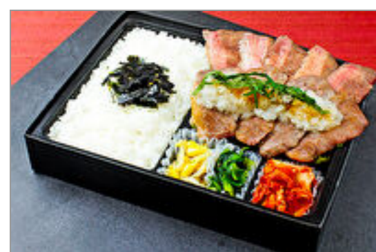
近江牛カルビと牛たんおろしポン酢弁当