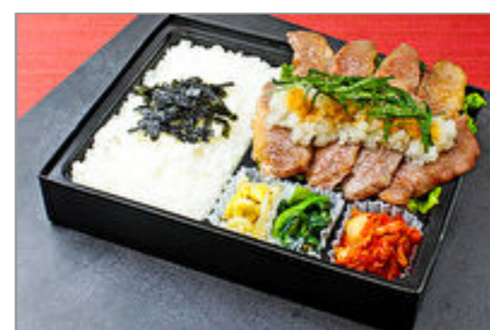
近江牛カルビとおろしポン酢弁当