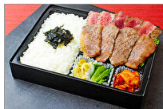
近江牛カルビとシンタマステーキ弁当