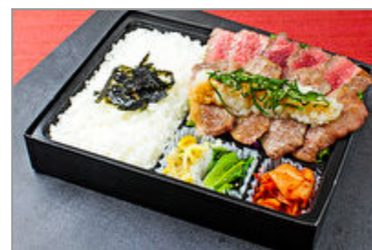
近江牛カルビとシンタマステーキおろしポン酢弁当