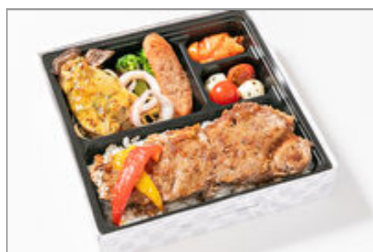
ステーキプレート