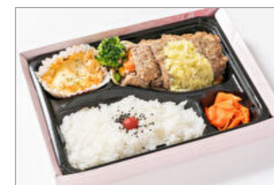
ミートローフのセロリソース