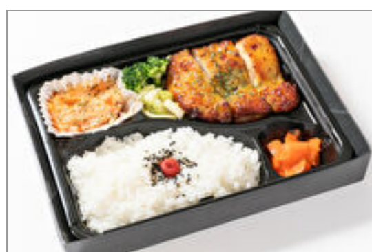
チキンハニーマスタード

商品によっては、注文条件やオプション・サービス等がございますので、詳しくはWEBでご確認ください。