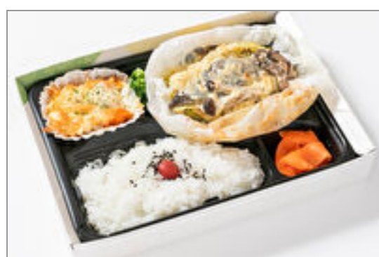
白身魚の包み焼き