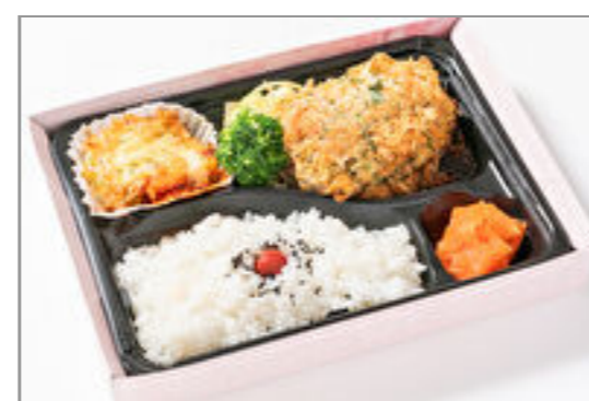
牛ミルフィーユカツレツ