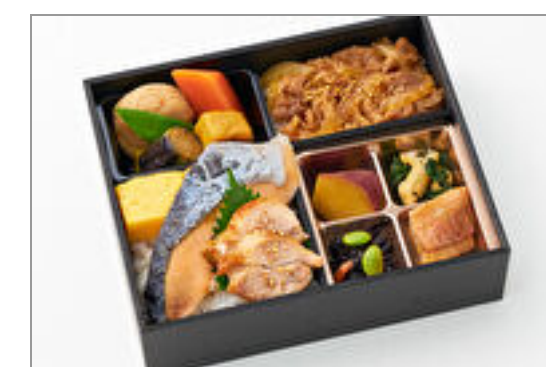
厳選国産牛すきと旨味熟成焼き鮭御膳