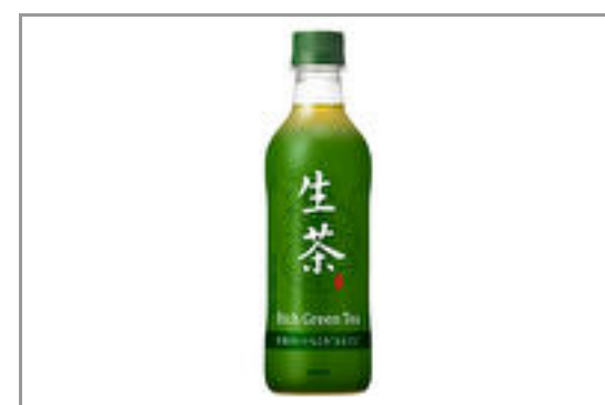
生茶(500ml ペットボトル)