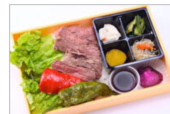
プレミアム赤身ステーキ弁当