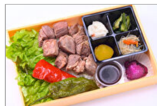
カットステーキ弁当