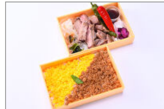
サーロイン&カットステーキ贅沢二段弁当