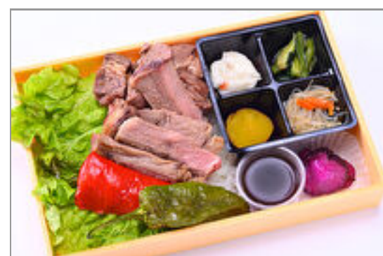
サーロイン&カットステーキ相盛り弁当