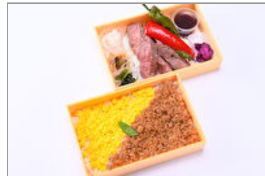
プレミアム赤身ステーキの贅沢二段弁当