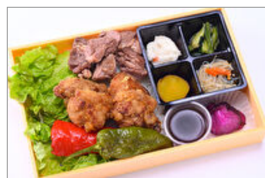
カットステーキ&唐揚げ弁当