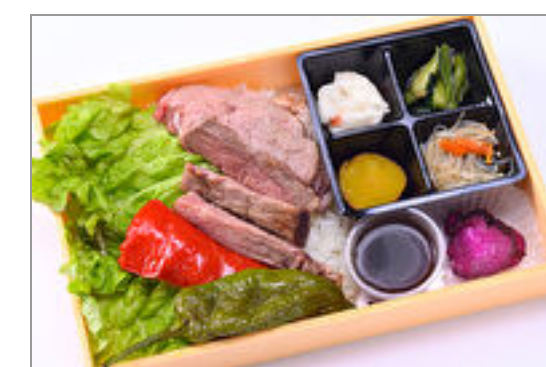
サーロインステーキ弁当