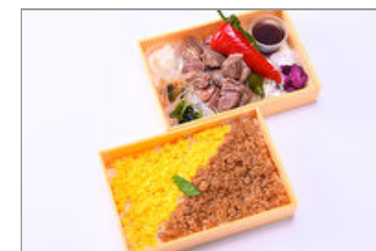
カットステーキの贅沢二段弁当