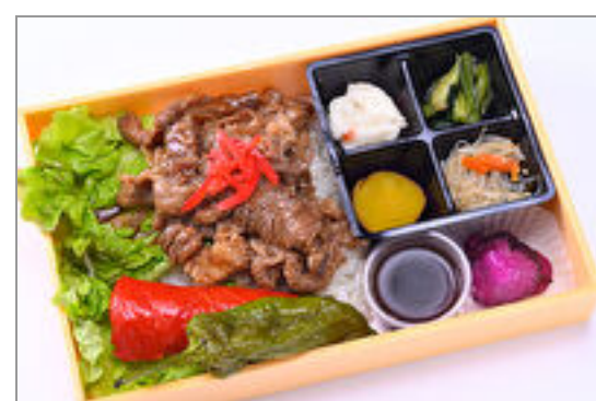
牛カルビ焼肉弁当

商品によっては、注文条件やオプション・サービス等がございますので、詳しくは WEB でご確認ください。