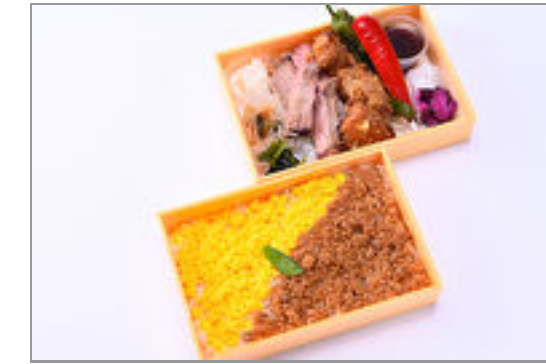
サーロインステーキ&唐揚げの贅沢二段弁当