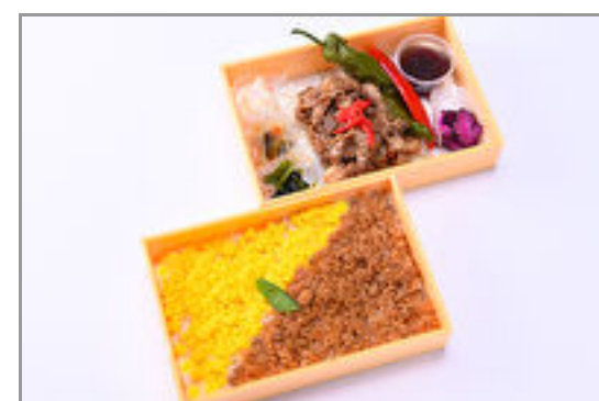
カルビ焼肉の贅沢二段弁当