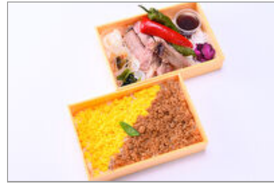
サーロインステーキの贅沢二段弁当