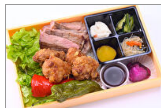
サーロインステーキ&唐揚げ弁当