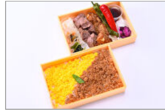
カットステーキ&唐揚げの贅沢二段弁当