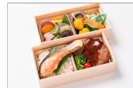
和牛ハンバーグ×焼き鮭弁当 1,667円(税込1,800円)／品番:STDQ015