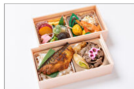
特選牛すき×鯖の生姜味噌弁当 1,667円(税込1,800円)／品番:STDQ020