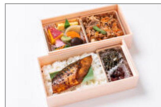
豚スタミナ焼き×鯖の生姜味噌弁当 1,371円(税込1,480円)／品番:STDQ014