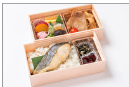
豚生姜焼き×鯖の西京焼き弁当