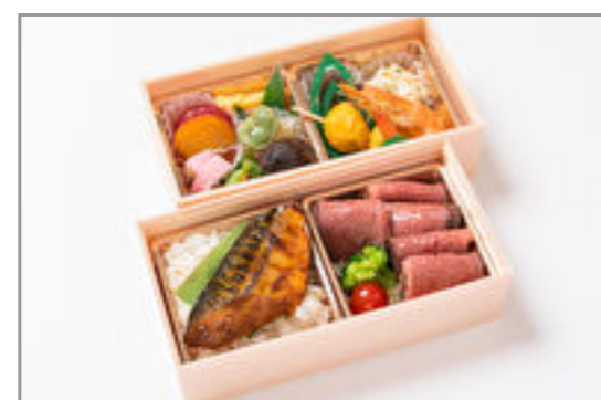
厚切りローストビーフ×鯖の生姜味噌弁当 2,130円(税込2,300円)／品番:STDQ023