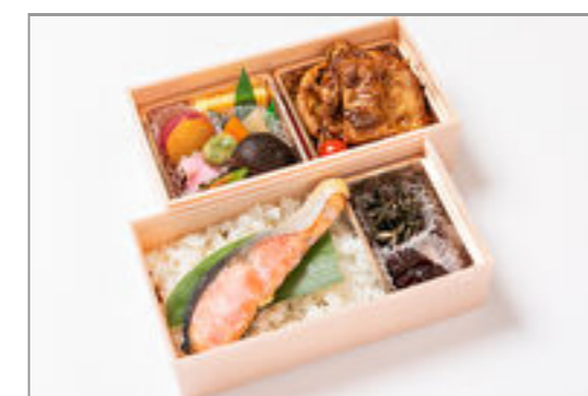
秩父味噌豚ロース×焼き鮭弁当