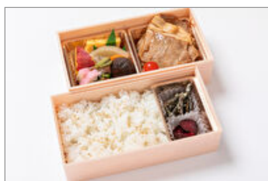
豚の生姜焼き弁当

商品によっては、注文条件やオプション・サービス等がございますので、詳しくは WEB でご確認ください。