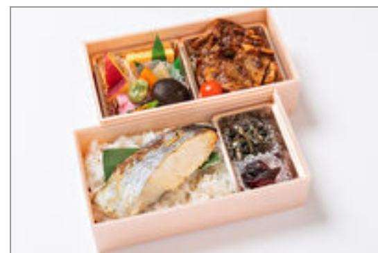
秩父味噌豚ロース×鯖の西京焼き弁当 1,371円(税込1,480円)／品番:STDQ010