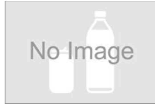
麒麟生茶 (500ml ペットボトル)