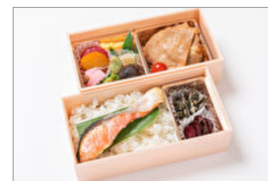
豚生姜焼き×焼き鮭弁当