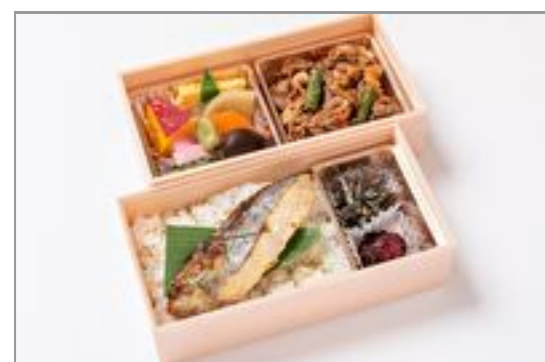
豚スタミナ焼き×鯖の西京焼き弁当 1,371円(税込1,480円)／品番:STDQ013