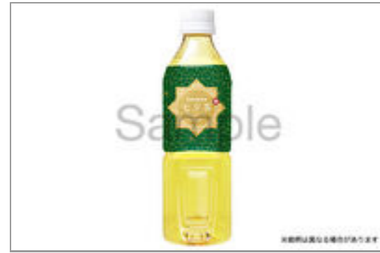
緑茶 (500ml ペット ボトル)