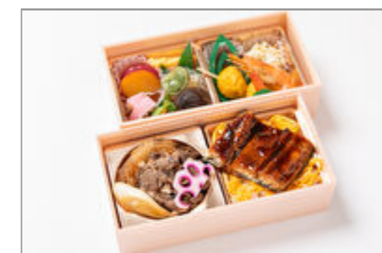
豪華うなぎ幕ノ内弁当 2,315円(税込2,500円)／品番:STDQ024