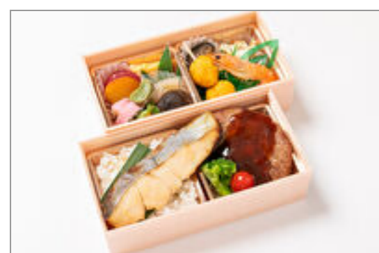
和牛ハンバーグ×鯖の西京焼き弁当 1,667円(税込1,800円)／品番:STDQ016