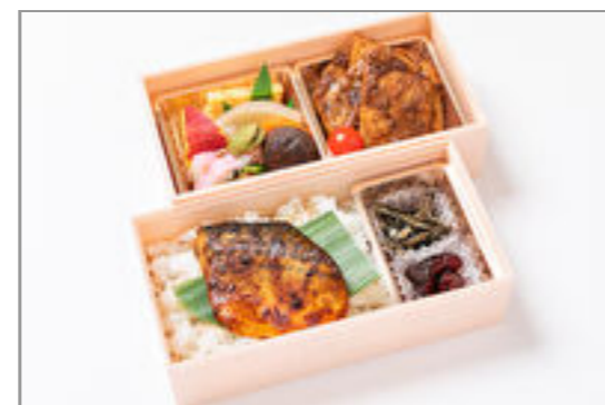
秩父味噌豚ロース×鯖の生姜味噌弁当 1,371円(税込1,480円)／品番:STDQ011