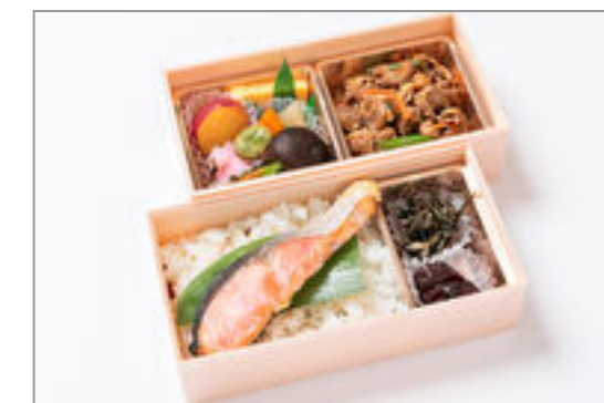
豚スタミナ焼き×焼き鮭弁当 1,371円(税込1,480円)／品番:STDQ012