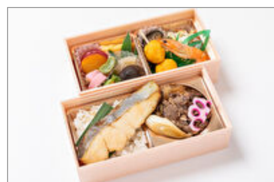
特選牛すき×鯖の西京焼き弁当 1,667円(税込1,800円)／品番:STDQ019