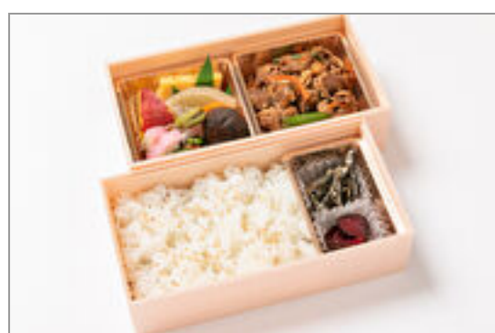
豚スタミナ焼き弁当