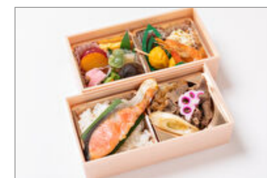
特選牛すき×焼き鮭弁当 1,667円(税込1,800円)／品番:STDQ018