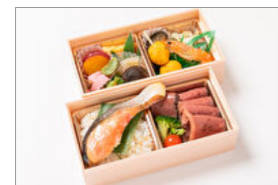
厚切りローストビーフ×焼き鮭弁当 2,130円(税込2,300円)／品番:STDQ021