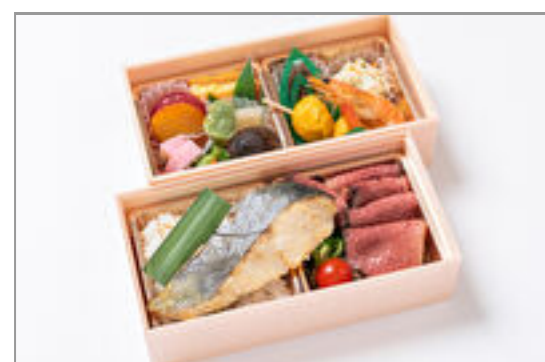
厚切りローストビーフ×鯖の西京焼き弁当 2,130円(税込2,300円)／品番:STDQ022