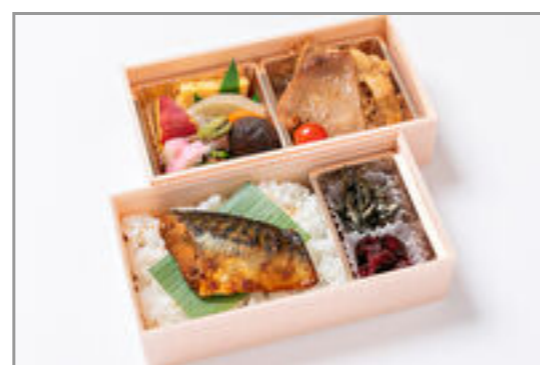
豚生姜焼き×鯖の生姜味噌弁当