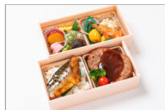
和牛ハンバーグ×鯖の生姜味噌弁当 1,667円(税込1,800円)／品番:STDQ017