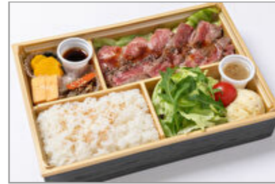
国産牛のサーロインステーキ御膳