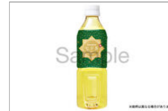
緑茶(500ml ペットボトル)