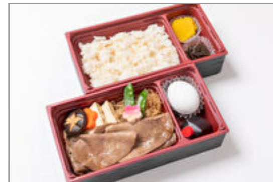
2段重ねのすき焼き重