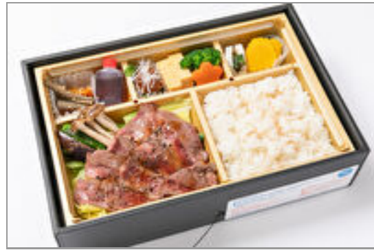
【温まる】蒸熱サーロインステーキ御膳