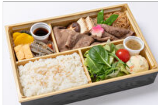
黒毛和牛のすき焼き御膳