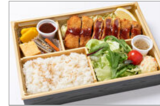
国産サーロインの牛カツ御膳