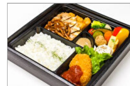
【温まる】熟成豚のグリル きのこのデミグラスソースとカニクリームコロッケ弁当 2,315円(税込2,500円) / 品番:CKDI024