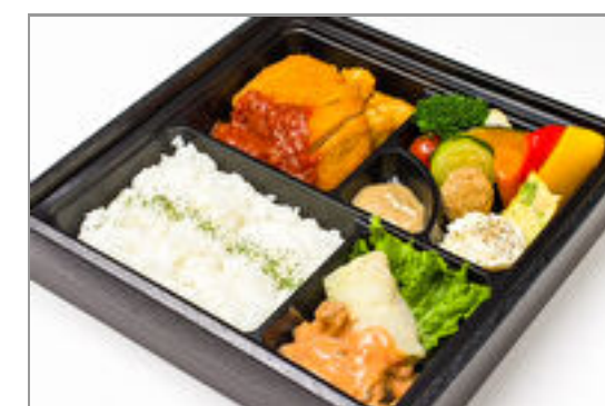
若鶏のミラノ風カツレツと ロールキャベツ弁当