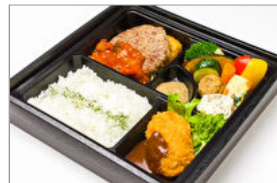
”極やわ”和牛ハンバーグ ラタトゥイユソースとカニクリームコロッケ弁当 2,000円(税込2,160円) / 品番:CKDI011