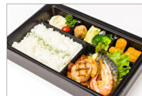
海の幸のグリル&ロースト ボスカイオーラソース弁 当