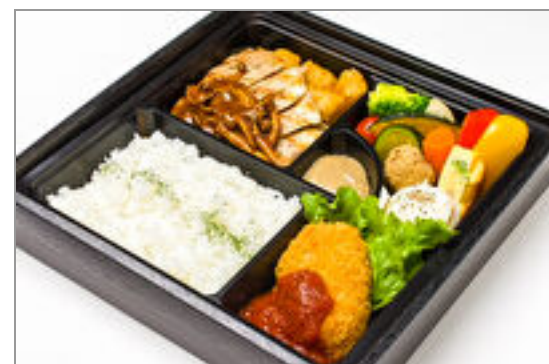
熟成豚のグリル きのこのデミグラスソースとカニクリームコロッケ弁当 2,000円(税込2,160円) / 品番:CKDI010