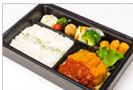
若鶏のミラノ風カツレツ 完熟トマトソース弁当

商品によっては、注文条件やオプション・サービス等がございますので、詳しくはWEBでご確認ください。