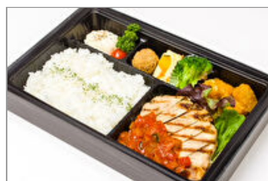
熟成豚のグリル ラタトゥ イユソース弁当