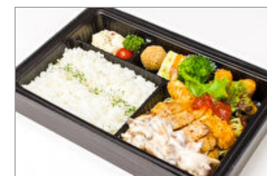
【温まる】若鶏のグリル きのこのクリームソースと大きな海老フライ弁当 2,130円(税込2,300円) / 品番:CKDI021