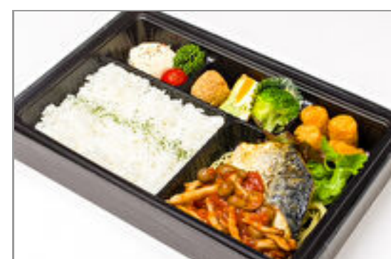
【温まる】白身魚のロースト ポスカイオーラソース弁当 1,800円(税込1,944円) / 品番:CKDI017