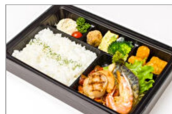
【温まる】海の幸のグリル&ロースト ポスカイオーラソース弁当 2,130円(税込2,300円) / 品番:CKDI020