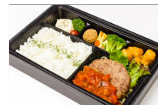
【温まる】”極やわ”和牛ハンバーグ ラタトゥイユソース弁当 2,000円(税込2,160円) / 品番:CKDI018