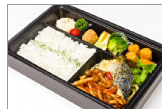
白身魚のロースト ボスカ イオーラソース弁当