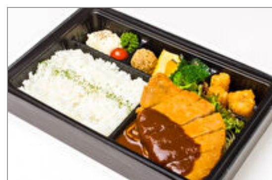
【温まる】熟成豚のミラノ風デミカツレツ弁当 2,000円(税込2,160円) / 品番:CKDI019