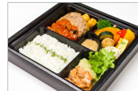
”極やわ”和牛ハンバーグ ラタトゥイユソースとロールキャベツ弁当 2,315円(税込2,500円) / 品番:CKDI012