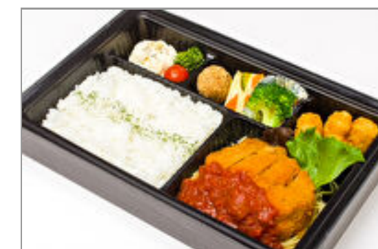
【温まる】若鶏のミラノ風カツレツ 完熟トマトソース弁当 1,800円(税込1,944円) / 品番:CKDI015