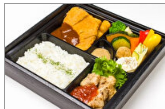
熟成豚のミラノ風デミカツレツと若鶏の炭火ロースト弁当 2,315円(税込2,500円) / 品番:CKDI013