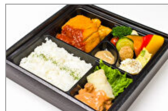
【温まる】若鶏のミラノ風カツレツとロールキャベツ弁当 2,315円(税込2,500円) / 品番:CKDI023