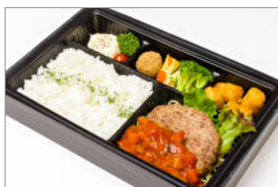
”極やわ” 和牛ハンバー グ ラタトゥイユソース弁 当