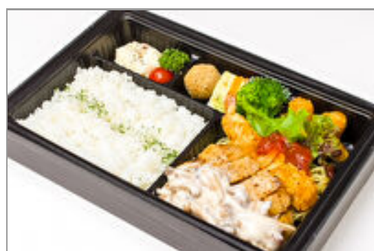
若鶏のグリル きのことクリ ームソースと大きな海老フ ライ弁当