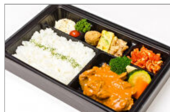
【温まる】ビーフストロガノフ弁当 2,315円(税込2,500円) / 品番:CKDI022