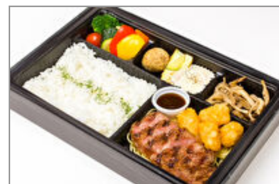
極上霜降り黒毛和牛のステーキ弁当 2,500円(税込2,700円) / 品番:CKDI014