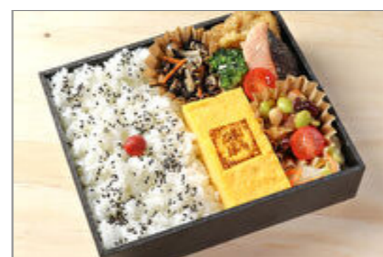
丸武でかい玉子焼き黒御膳 鮭西京焼き