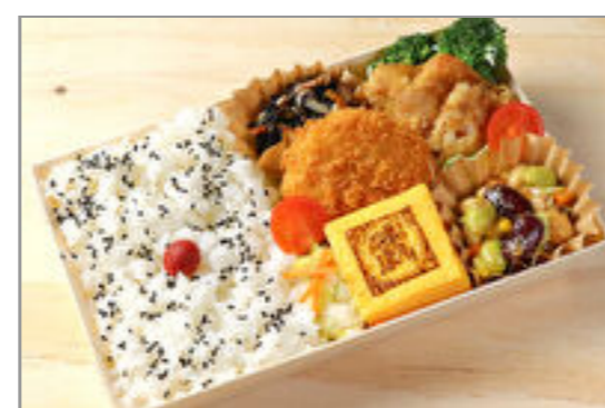
丸武玉子焼きと特製コロッケ謹製弁当