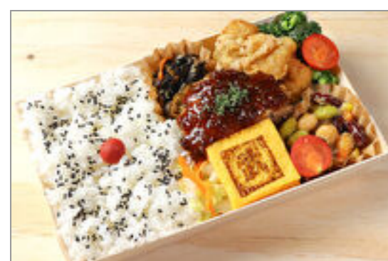
丸武玉子焼きと粗挽きハンバーグ謹製弁当

商品によっては、注文条件やオプション・サービス等がございますので、詳しくはWEBでご確認ください。