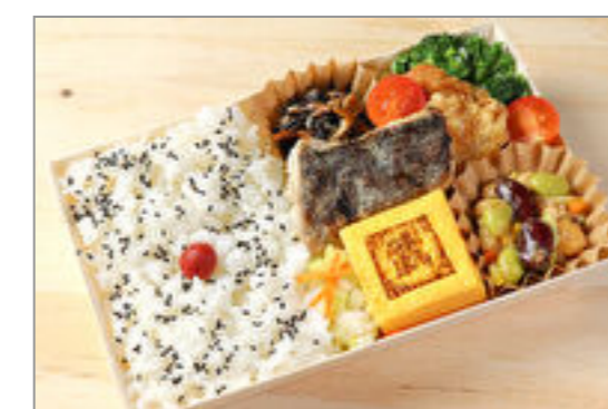
丸武玉子焼きと北海道産ホッケ西京焼き謹製弁当