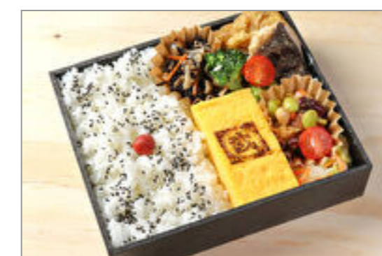
丸武でかい玉子焼き黒御膳 ホッケ西京焼き