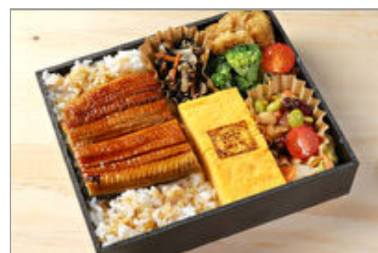
丸武でかい玉子焼き黒御膳 鰻蒲焼き