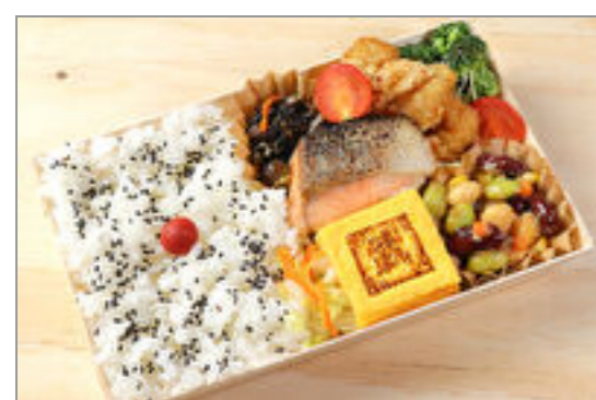
丸武玉子焼きと北海道産鮭西京焼き謹製弁当