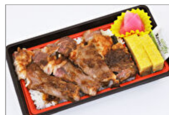
黒毛和牛ステーキ弁当