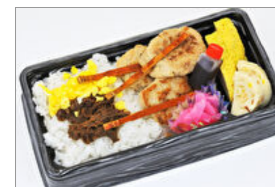
仙台牛しぐれ煮となんこつ入り手づくりつくね弁当