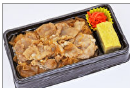
せんだいぎゅうどん弁当

商品によっては、注文条件やオプション・サービス等がございますので、詳しくは WEB でご確認ください。