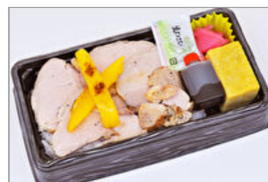
ロースト宮城野ポーク弁当