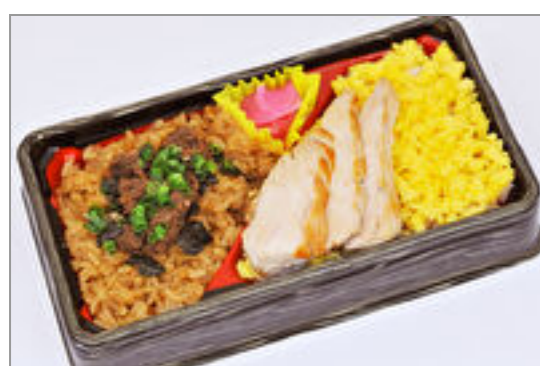
仙台牛しぐれ煮と鶏照り焼きと玉子そぼろ弁当