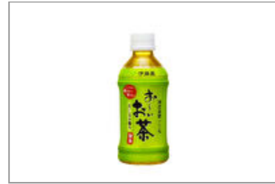
お〜いお茶(350ml ペットボトル)