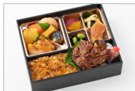
厳選国産牛の極み炙り焼肉と牛すき御膳