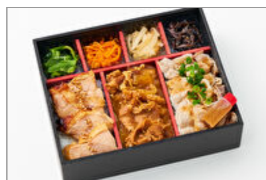
【贅沢肉三昧】牛豚鶏のよくばり満福御膳