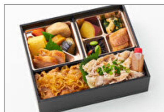
厳選国産牛すきと焙煎ごまの豚しゃぶ御膳