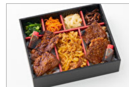
【贅沢肉三昧】厳選国産牛すきと国産牛焼肉食べ比べ御膳