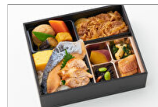
厳選国産牛すきと旨味熟成焼き鮭御膳