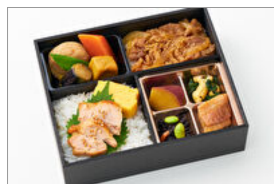
厳選国産牛すき御膳

商品によっては、注文条件やオプション・サービス等がございますので、詳しくはWEBでご確認ください。