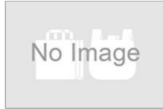
小分け用紙袋(小) 23円(税込25円) / 品番:TKQT1002