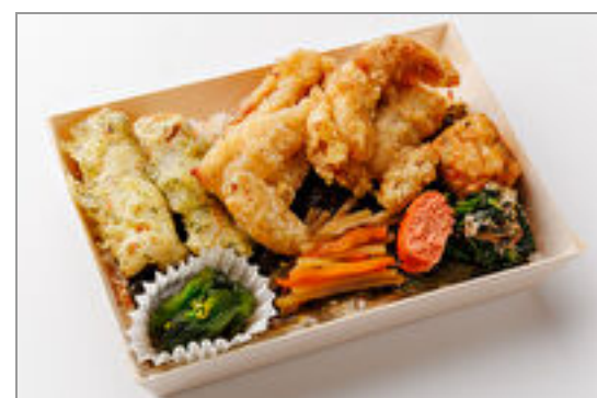
特製だしからあげの海苔弁当