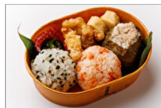
お米がおいしい!おにぎり弁当(わかめ・鮭・ツナマヨ)