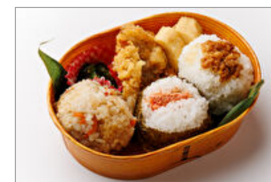
お米がおいしい!おにぎり弁当(だしむすび・焼きたらこ・肉そぼろ)