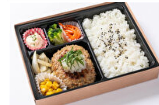
和風おろしハンバーグ弁当 1,000円(税込1,080円) / 品番:STDN013