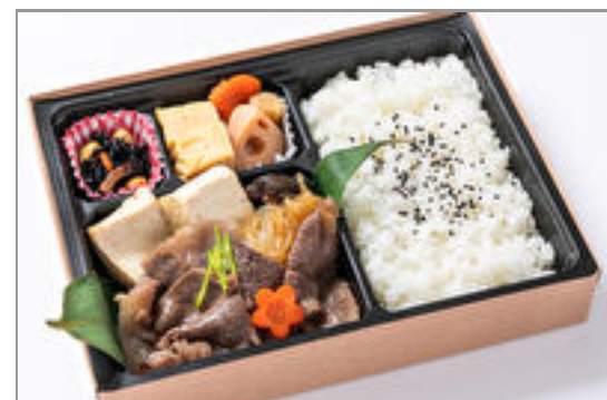
最高級A5ランク黒毛和牛すき弁当 1,500円(税込1,620円) / 品番:STDN014