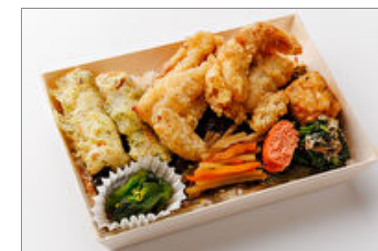
特製塩からあげの海苔弁当