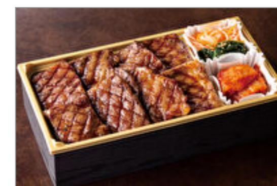
鹿児島黒牛サーロイン弁当