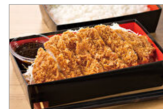
上ローズとんかつ弁当