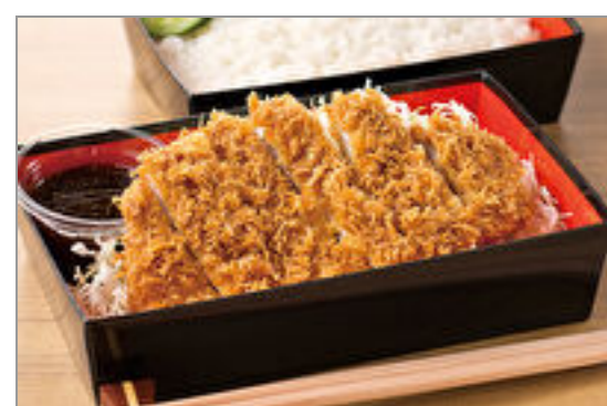
ローズとんかつ弁当

商品によっては、注文条件やオプション・サービス等がございますので、詳しくは WEB でご確認ください。