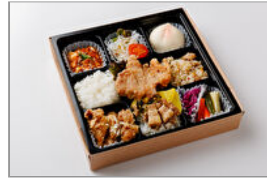
特選!彩リクラフト中華弁当(国産豚ロース肉の唐揚げ/パイクー) 1,000円(税込1,080円) / 品番:STDO011