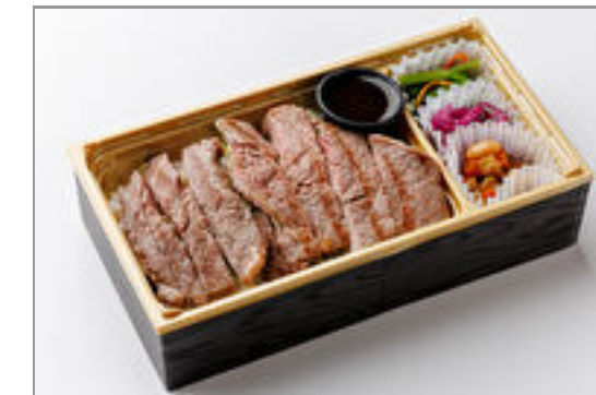
特選!牛ステーキ重 2,000円(税込2,160円) / 品番:STDO015