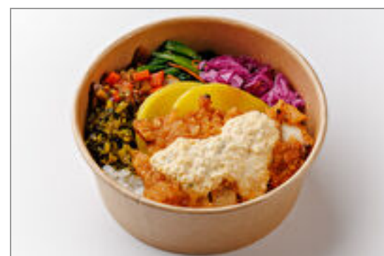
ワンBOX!自家製タルタルのチキン南蛮DON