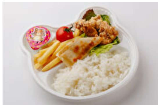
お子さまパンダ弁当 700円(税込756円) / 品番:STDO016