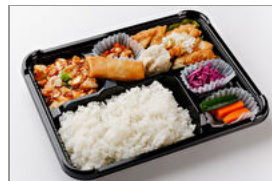
シェフお勧め!THE中華弁当(油淋鶏/ユーリンチー)