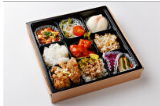
特選!彩リクラフト中華弁当(エビのチリソース) 1,000円(税込1,080円) / 品番:STDO013