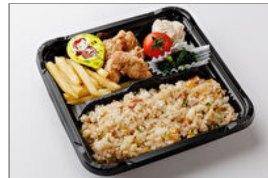
MOMOZONO Kid's弁当 800円(税込864円) / 品番:STDO017