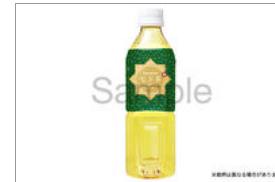
緑茶(500ml ペットボトル) 167円(税込180円) / 品番:STDO801