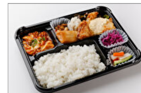
シェフお勧め!THE中華弁当(自家製タルタルのチキン南蛮)