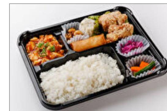
シェフお勧め!THE中華弁当(鶏のから揚げ)