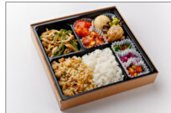
特選!シェフおまかせ モモゾノ御膳弁当 1,600円(税込1,728円) / 品番:STDO014