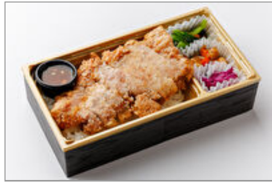
台湾名物!国産豚ロース肉の パイクー(豚唐揚げ)重 1,000円(税込1,080円) / 品番:STDO010