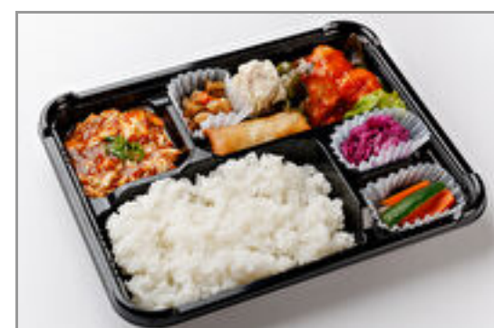
シェフお勧め!THE中華弁当(エビのチリソース)