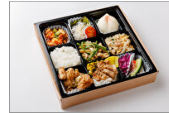
特選!彩リクラフト中華弁当(チンジャオロース/青椒肉絲) 1,000円(税込1,080円) / 品番:STDO012