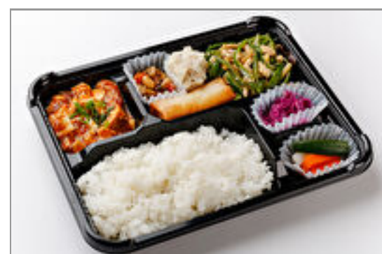
シェフお勧め!THE中華弁当(チンジャオロース/青椒肉絲)