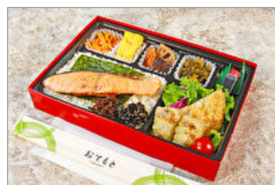
かつやまのしゃけのり弁当

商品によっては、注文条件やオプション・サービス等がございますので、詳しくは WEB でご確認ください。