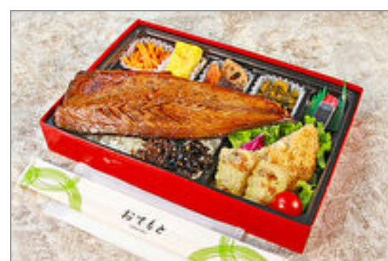
長崎県産はみ出るさばのみりん焼き弁当