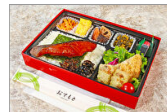
高級銀だらみりん焼き弁当