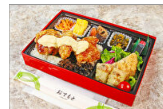
チキン南蛮タルタルソース弁当