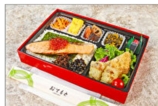
こぼれいくらのしゃけのり弁当