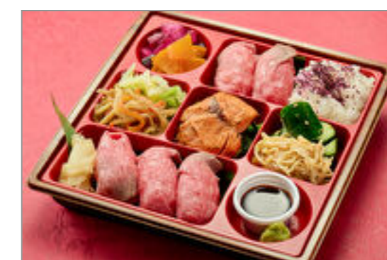
【熨斗対応可】めし橋特選肉寿司御膳【肉寿司5貫】