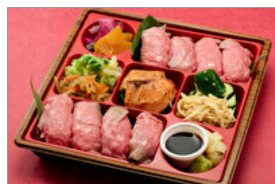
【熨斗対応可】贅沢肉寿司御膳【肉寿司8貫】