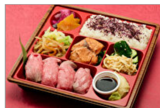
【熨斗対応可】お手軽肉寿司御膳【肉寿司4貫】