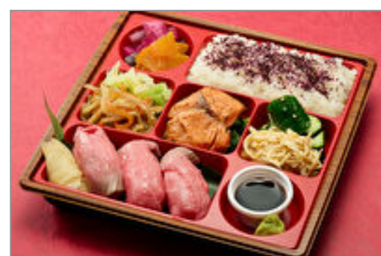
【熨斗対応可】お手軽肉寿司御膳【肉寿司3貫】

商品によっては、注文条件やオプション・サービス等がございますので、詳しくはWEBでご確認ください。