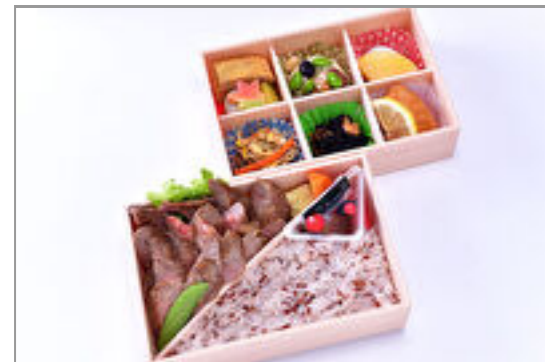
香川県産オリーブ牛ステーキ 弁当「極」～お肉増量～