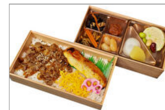
金目鯛の西京焼きと和牛しぐれ煮弁当