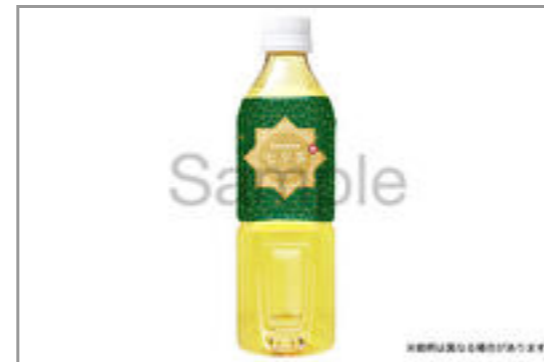
緑茶(500ml ペット ボトル)