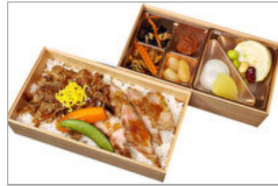
牛ステーキと和牛しぐれ煮 弁当