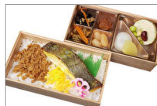
目鯛の西京焼きと鶏しぐれ弁当