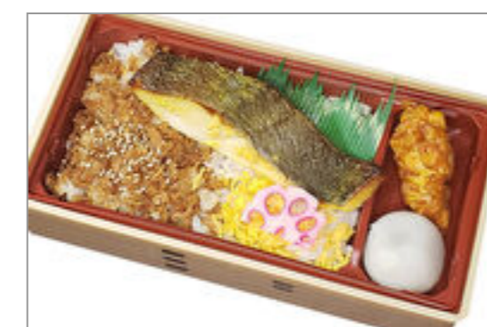
目鯛の西京焼きと鶏しぐれ重