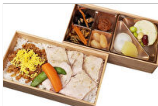
三元豚のローストポークと鶏しぐれ弁当