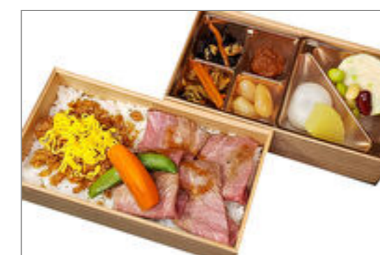
ローストビーフと鶏しぐれ弁当