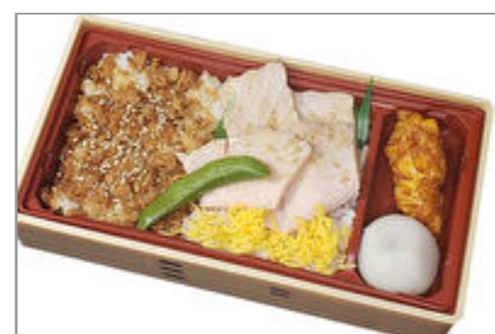
三元豚のローストポークと鶏しぐれ重