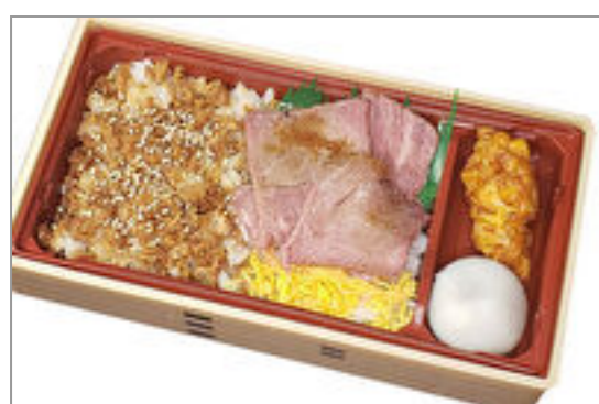
ローストビーフと鶏しぐれ重

商品によっては、注文条件やオプション・サービス等がございますので、詳しくはWEBでご確認ください。