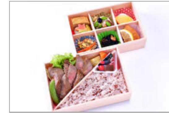
香川県産オリーブ牛ステーキ 弁当「匠」