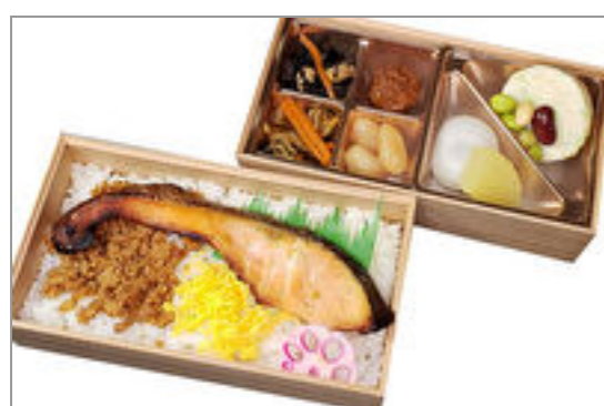
銀鮭西京焼きと鶏しぐれ煮弁当