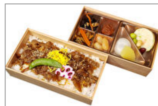
特製和牛しぐれ煮重弁当