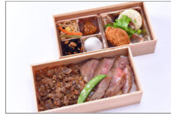
香川県産オリーブ牛ステーキ と和牛しぐれ煮弁当