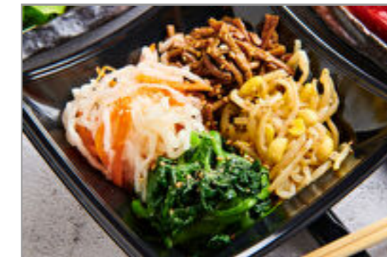
ナムル盛り合わせ