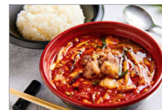
カルビスープ弁当