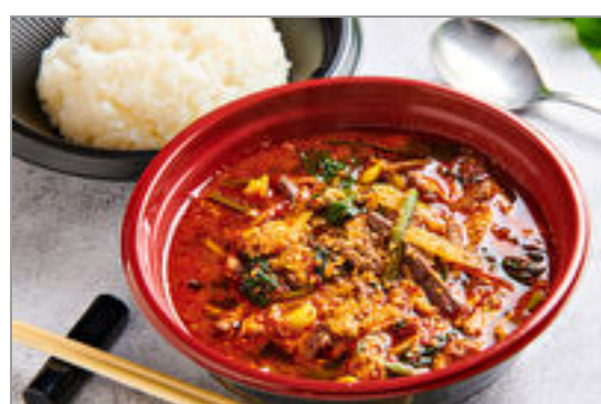
ユッケジャンスープ弁当