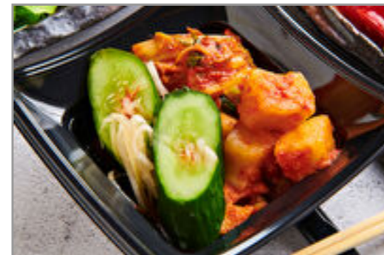
キムチ盛り合わせ