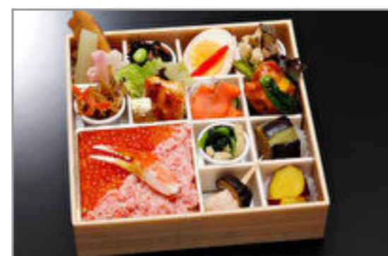
かにいくらちらし御膳