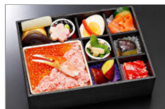
かにいくらちらし弁当