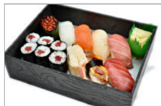
特上寿司(巻物入り)