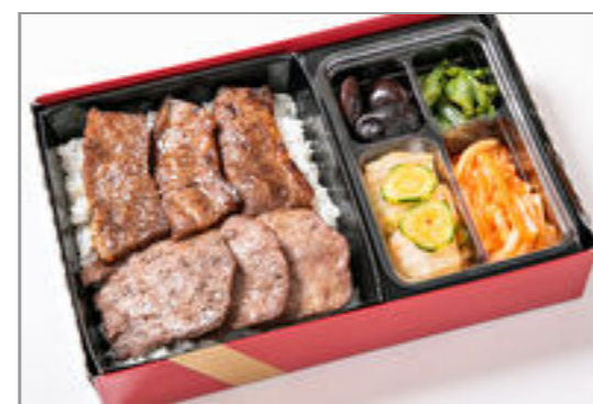
カルビ&上タン塩弁当 (和風・にんにく味抜き)