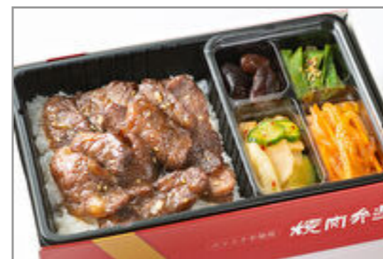
【熨斗対応可】牛切落とし弁当 (和風・にんにく味抜き)