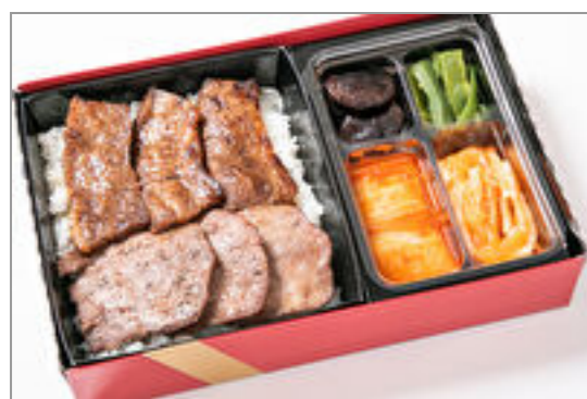
カルビ&上タン塩弁当

商品によっては、注文条件やオプション・サービス等がございますので、詳しくは WEB でご確認ください。