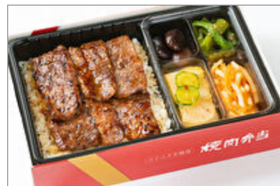
【熨斗対応可】カルビ弁当 (和風・にんにく味抜き)