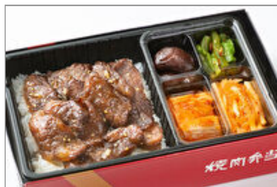
【熨斗対応可】牛切落とし弁当