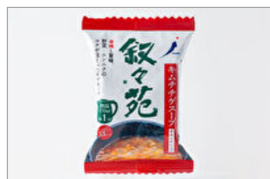
キムチチゲスープ(容器付)