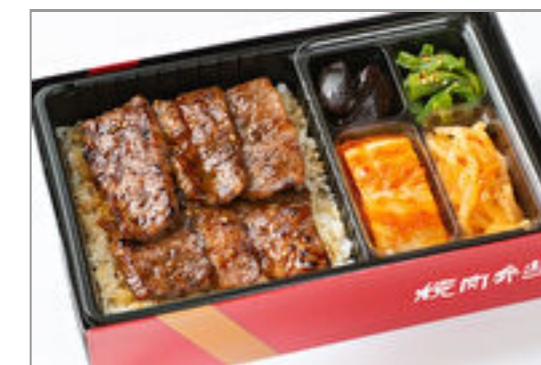
【熨斗対応可】カルビ弁当