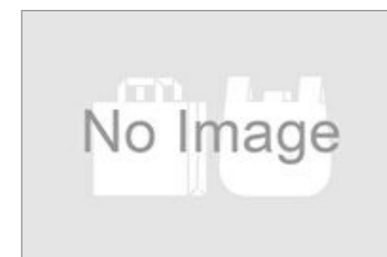
紙袋(黒 ロゴ入り) 中