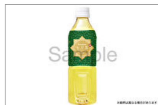
緑茶(500ml ペット ボトル)