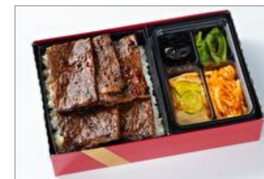
上ロース弁当 (和風・にんにく味抜き)