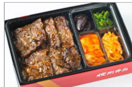
特選サーロイン弁当