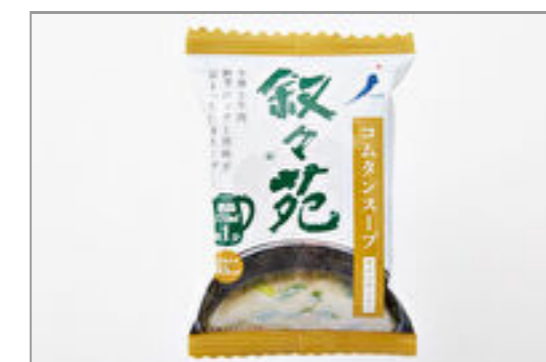
コムタンスープ(容器付)