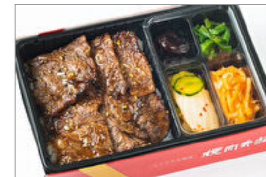
特選サーロイン弁当(和風 ・にんにく味抜き)