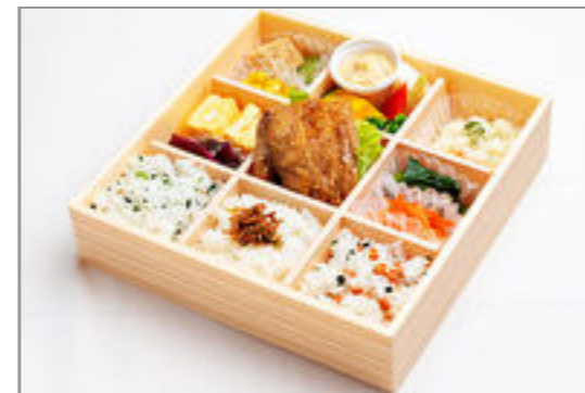
鶏の照り焼き御膳