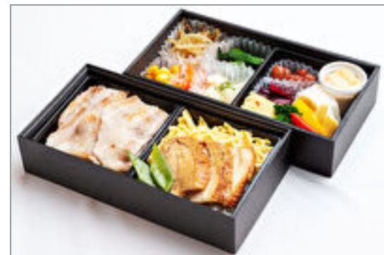
塩豚と鶏の照り焼き二段重

商品によっては、注文条件やオプション・サービス等がございますので、詳しくは WEB でご確認ください。