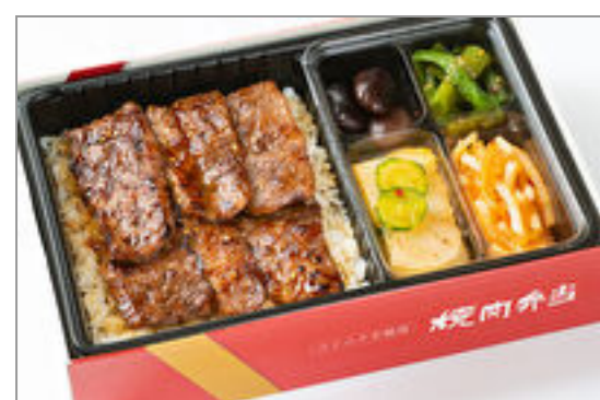
カルビ弁当(和風・にんにく味抜き) 3,149円 (税込3,400円) / 品番:KNES004