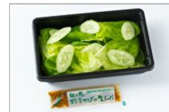
叙々苑サラダ 602円(税込650円) / 品番:KNES015