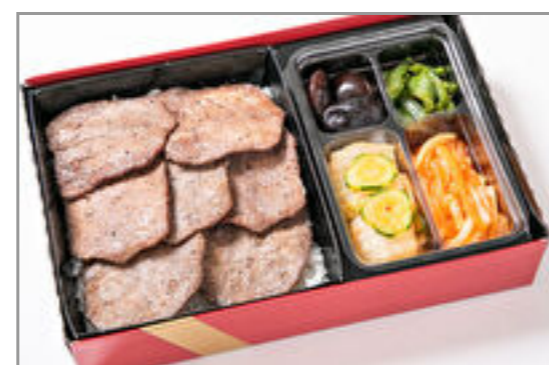
上タン塩弁当(和風・にんにく味抜き) 3,426円 (税込3,700円) / 品番:KNES008