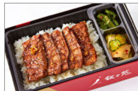
カルビ弁当コンパクトサイズ(和風・にんにく味抜き) 2,593円(税込2,800円) / 品番:KNES014