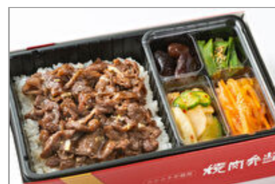
牛薄切弁当(和風・にんにく味抜き) 2,593円 (税込2,800円) / 品番:KNES002