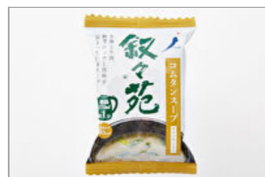
コムタンスープ(容器付) 330円(税込356円) / 品番:KNES017