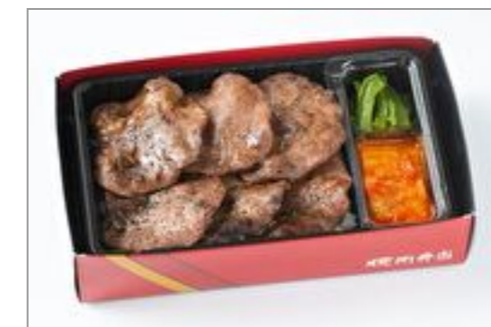
上タン塩弁当コンパクトサイズ(和風・にんにく味抜き) 2,871円(税込3,100円) / 品番:KNES012