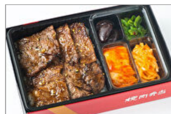
特選サーロイン弁当 4,167円 (税込4,500円) / 品番:KNES005