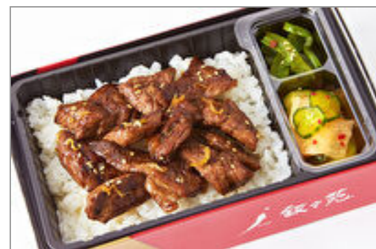
牛切落とし弁当コンパクトサイズ(和風・にんにく味抜き) 2,223円(税込2,400円) / 品番:KNES010