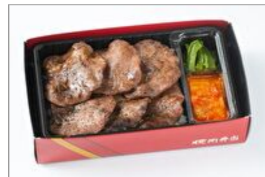
上タン塩弁当コンパクトサイズ 2,871円(税込3,100円) / 品番:KNES011