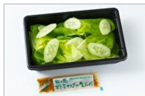
叙々苑サラダ(にんにく味抜き) 602円(税込650円) / 品番:KNES016