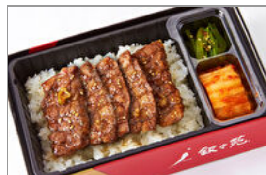
カルビ弁当コンパクトサイズ 2,593円(税込2,800円) / 品番:KNES013