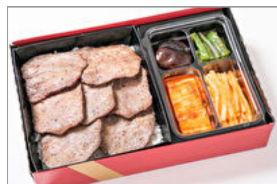
上タン塩弁当 3,426円 (税込3,700円) / 品番:KNES007