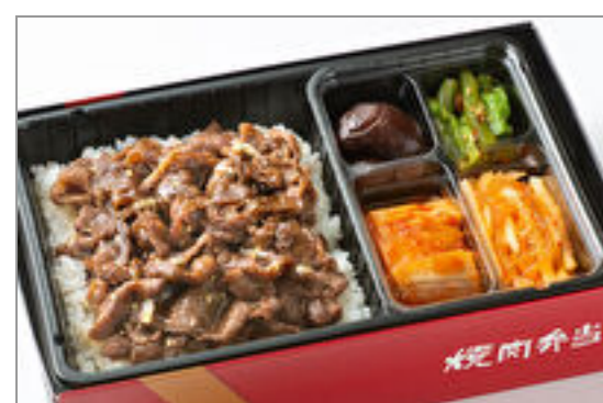
牛薄切弁当 2,593円 (税込2,800円) / 品番:KNES001

1976年、東京六本木にオープンした焼肉叙々苑は、お客様に最上のおいしさ「価値のあるおいしさ」を味わっていただくための工夫を常に続けてきました。そんな叙々苑の焼肉を店舗以外でも楽しみたいという要望にお応えしてお弁当の販売を開始しました。ぜひご利用ください。