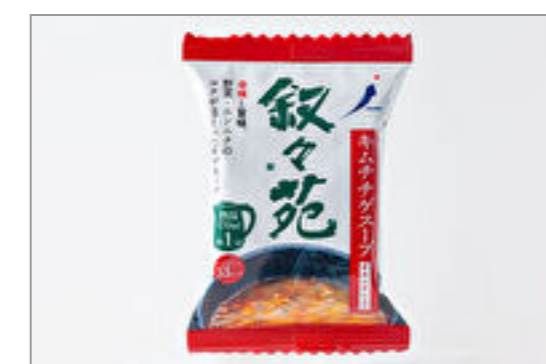
キムチゲスープ(容器付) 330円(税込356円) / 品番:KNES018