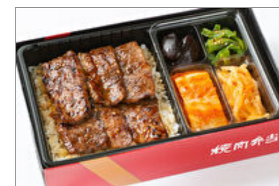
カルビ弁当 3,149円 (税込3,400円) / 品番:KNES003