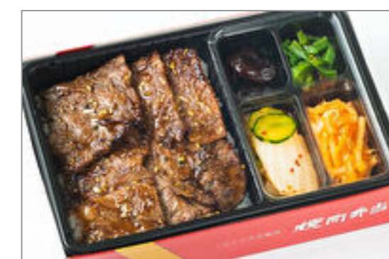
特選サーロイン弁当(和風・にんにく味抜き) 4,167円 (税込4,500円) / 品番:KNES006