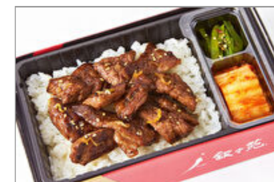
牛切落し弁当コンパクトサイズ 2,223円 (税込2,400円) / 品番:KNES009