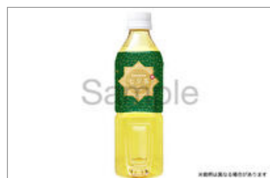
緑茶(500ml ペットボトル) 186円(税込200円) / 品番:KNES801