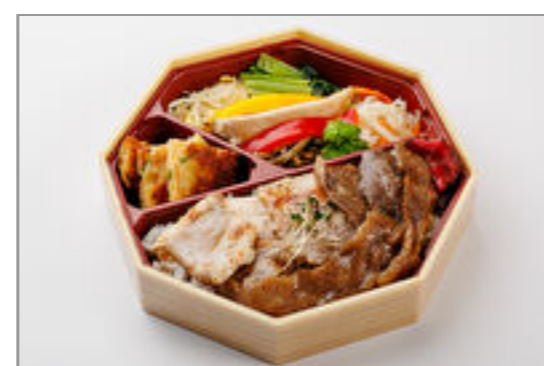
焼肉弁当 (国産牛カルビ & 国産豚バラ) 926円 (税込1,000円) / 品番: TKLL011