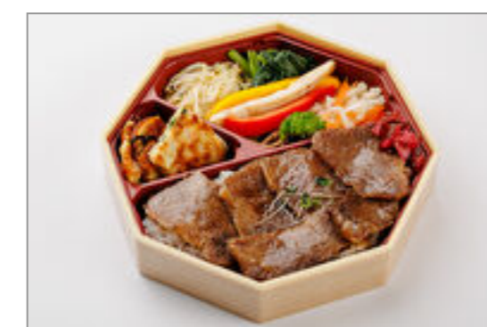
焼肉弁当 (和牛特上ロース) 1,500円 (税込1,620円) / 品番: TKLL005