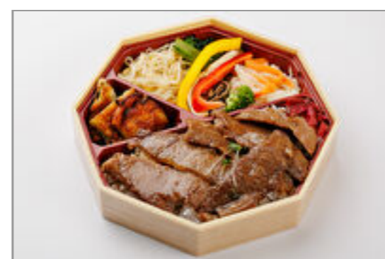
焼肉弁当 (和牛特上カルビ) 1,500円 (税込1,620円) / 品番: TKLL004