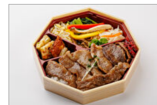
焼肉弁当 (国産牛カルビ) 1,000円 (税込1,080円) / 品番: TKLL012