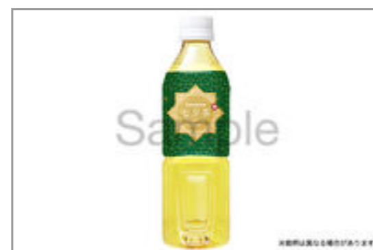
緑茶 (500mlペットボトル) 93円 (税込100円) / 品番: TKLL802