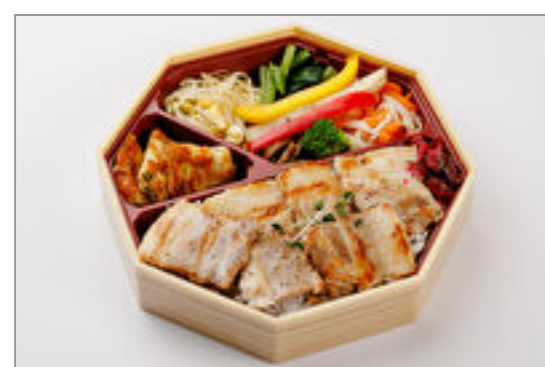
焼肉弁当 (国産豚バラ) 908円 (税込980円) / 品番: TKLL002

焼肉店こだわりの焼肉弁当は和牛や国産牛を使用した厳選弁当です。牛肉と豚肉両方お楽しみいただける2種類のお弁当や人気のカルビなど幅広くご用意しています。