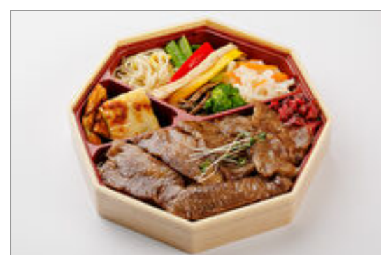
焼肉弁当 (和牛特上カルビ & 和牛特上ロース) 1,500円 (税込1,620円) / 品番: TKLL006