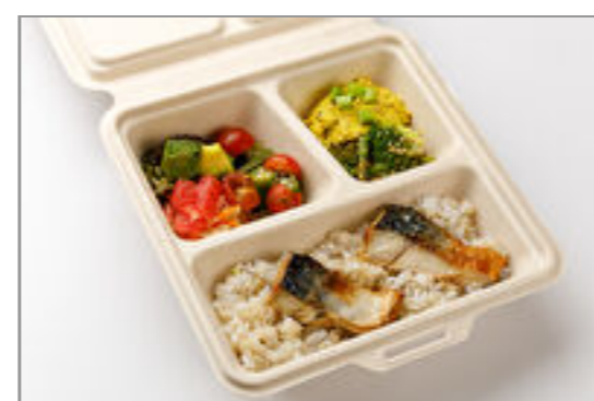
5品目野菜デリとさば塩焼きBOX