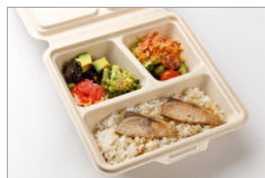
5品目野菜デリとぶり照焼きBOX

商品によっては、注文条件やオプション・サービス等がございますので、詳しくはWEBでご確認ください。