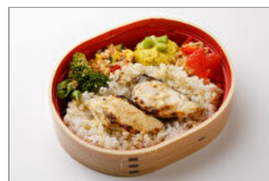
4品目野菜デリとさわら西京焼き弁当