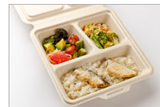
5品目野菜デリとさわら西京焼きBOX