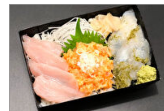
サーモン中落の三色ちらし重