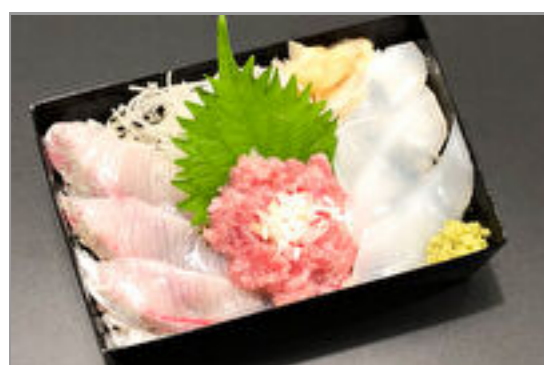
まぐろ中落の三色ちらし重