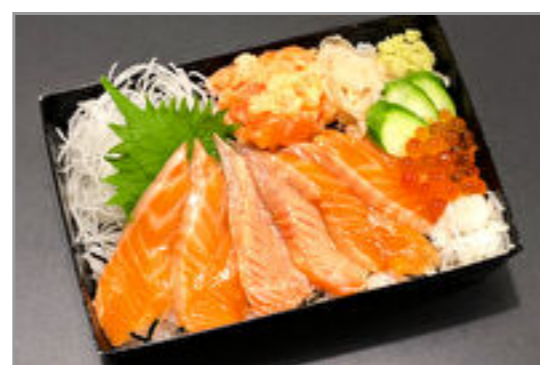
サーモン三味ちらし重