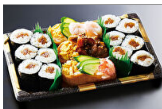
上助六~かわり稲荷と巻き物