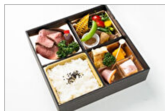
ローストビーフの洋彩OHAKO

商品によっては、注文条件やオプション・サービス等がございますので、詳しくはWEBでご確認ください。