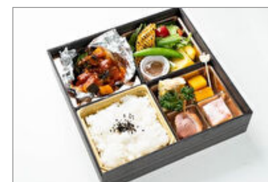
白身魚トマトソースの洋彩OHAKO