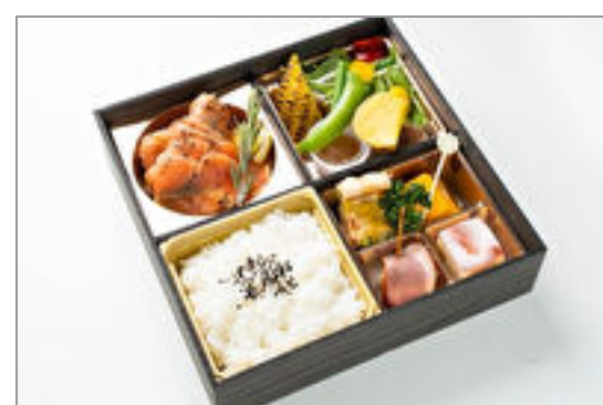
スモークサーモンの洋彩OHAKO