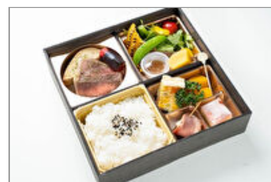
フォアグラ大根の洋彩OHAKO