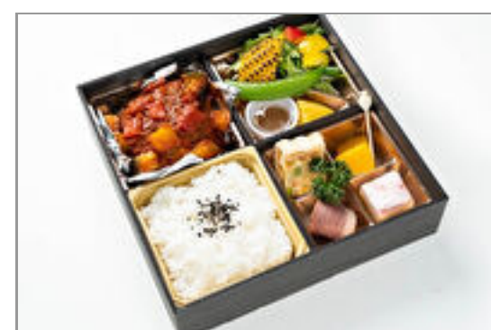
黒毛和牛ハンバーグの洋彩OHAKO