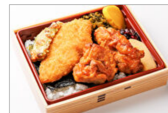
特製とりからの海苔弁当