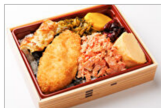
塩鮭のそぼろ海苔弁当