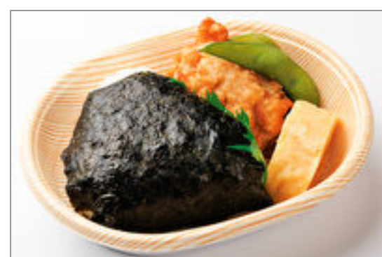
米も具も2倍!ボリューム満点おにぎりBOX

商品によっては、注文条件やオプション・サービス等がございますので、詳しくはWEBでご確認ください。