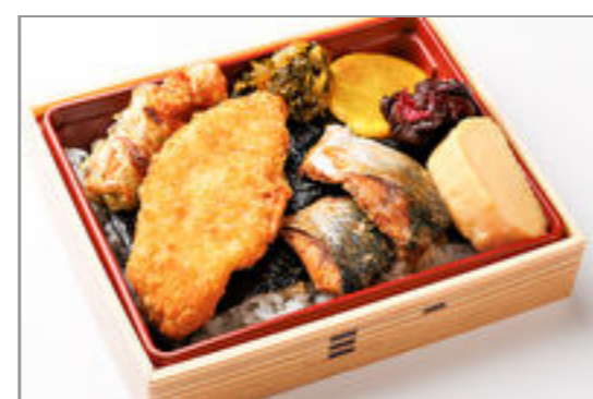
サバの味噌煮海苔弁当