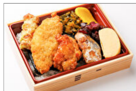
とりから&サバの味噌煮MIX海苔弁