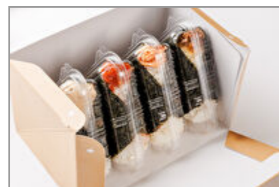
おにぎりギフトBOX(しやけ・ツナマヨ・うめ・おかか)