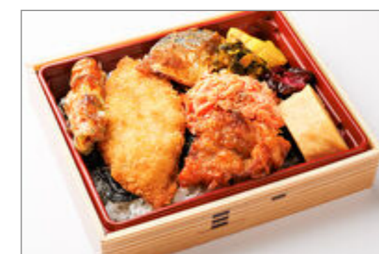
いたるの特製幕の内海苔弁当