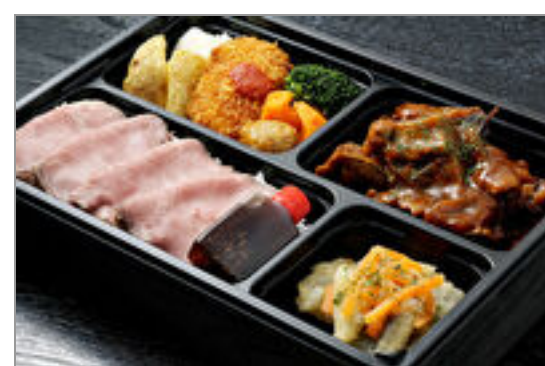
和牛すじ肉のデミグラス煮込みとローストビーフ丼