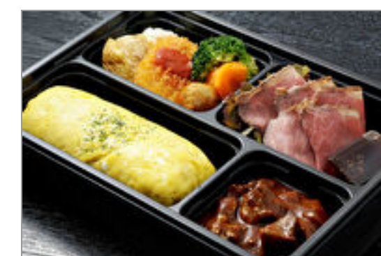
タンシチューオムライスとローストビーフの洋食御膳