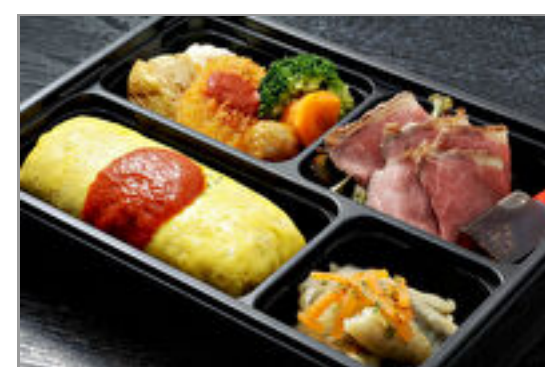
特製オムライスとローストビーフの洋食御膳