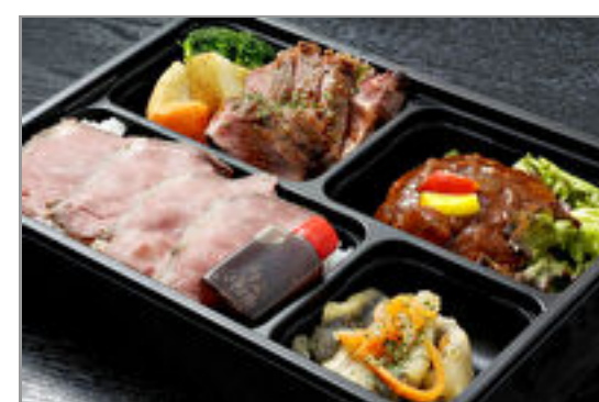
サーロインステーキと自家製煮込みハンバーグ御膳