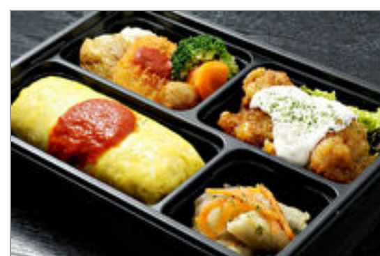
チキン南蛮と特製オムライス弁当

商品によっては、注文条件やオプション・サービス等がございますので、詳しくは WEB でご確認ください。