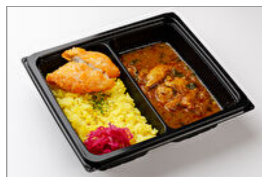
南インド風チキンカレー+フライドフィッシュ