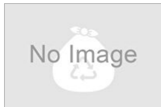
ごみ袋(45L) 5円(税込5円)／品番:TKLD1003