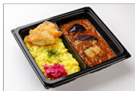
クラフトキーマカレー+バジルササミフライ