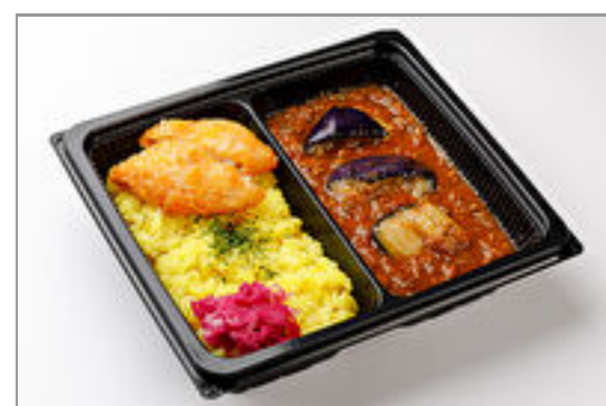
クラフトキーマカレー+フライドフィッシュ