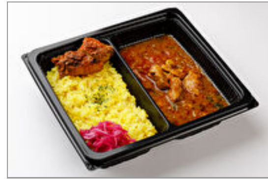
南インド風チキンカレー＋ チキンケバブグリル 900円(税込972円)／品番:TKLD010