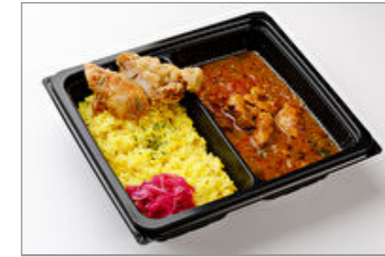
南インド風チキンカレー＋ タイ風バイマックルー唐揚 げ 900円(税込972円)／品番:TKLD012