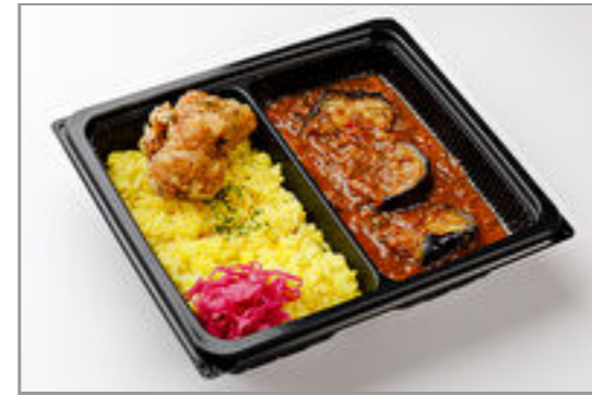
クラフトキーマカレー＋タ イ風バイマックルー唐揚げ 900円(税込972円)／品番:TKLD011