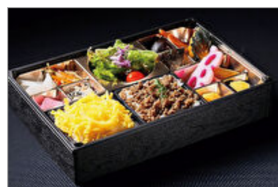
A5和牛の特製そばろ弁当

商品によっては、注文条件やオプション・サービス等がございますので、詳しくはWEBでご確認ください。