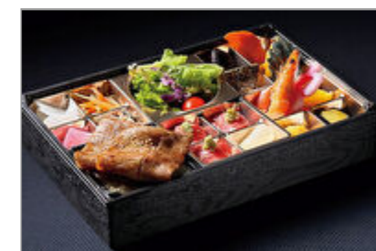
A5和牛みすじと肉寿司弁当