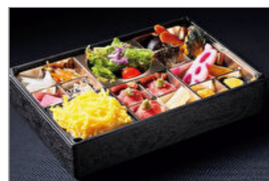
A5和牛の肉寿司弁当