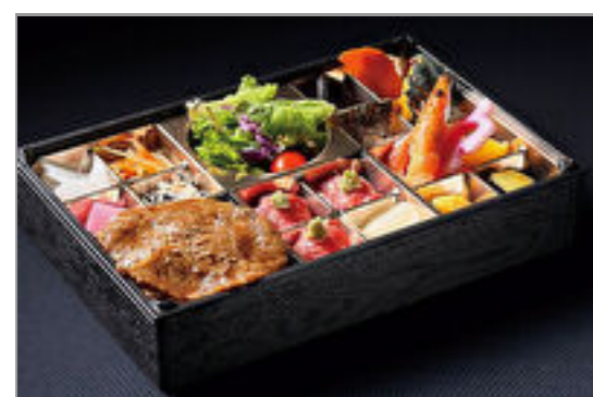
A5和牛上ロースと肉寿司弁当