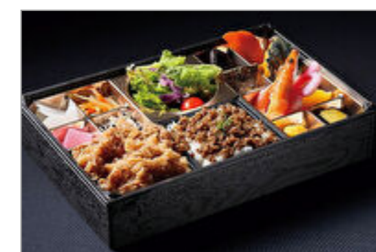
A5和牛のすき焼きと特製そばろ弁当