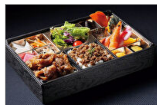
A5和牛の炭焼きカルビと特製そばろ弁当