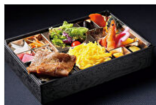
A5和牛みすじの肉おせち弁当