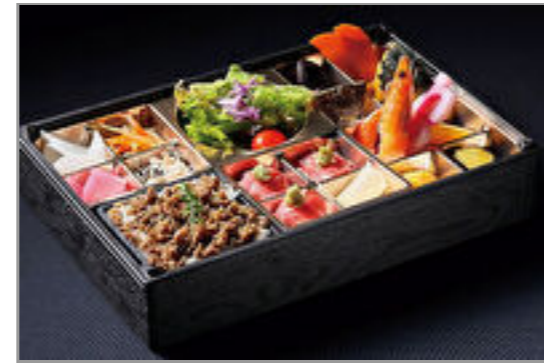
A5和牛の特製そぼろと肉寿司弁当