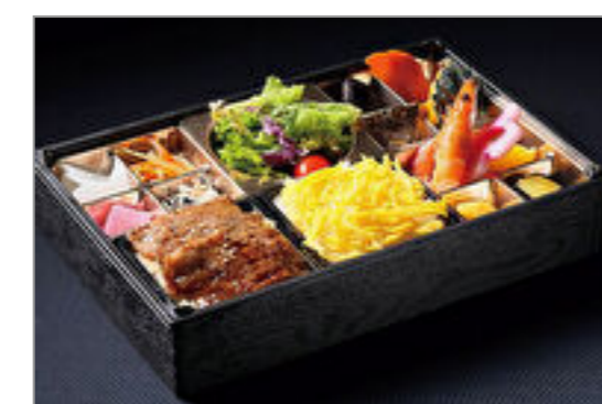
A5和牛特上カルビの肉おせち弁当