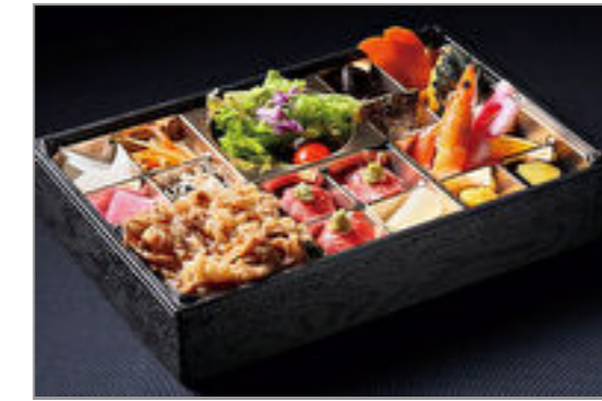
A5和牛のすき焼きと肉寿司弁当