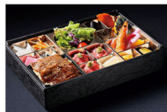
A5和牛特上カルビと肉寿司弁当