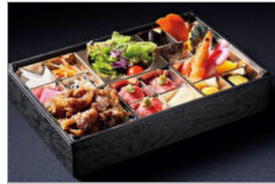
A5和牛の炭焼きカルビと肉寿司弁当