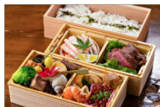
しまや 三段重村上牛ステーキ重