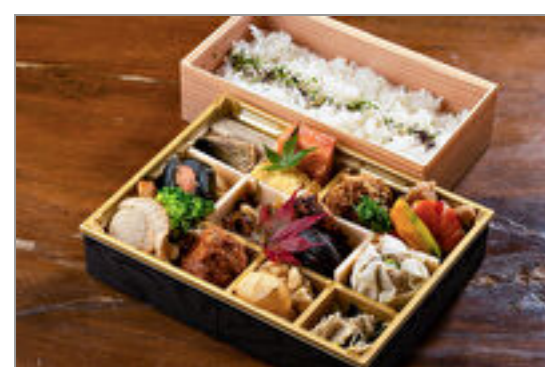
十二仕切り 彩り弁当

商品によっては、注文条件やオプション・サービス等がございますので、詳しくは WEB でご確認ください。