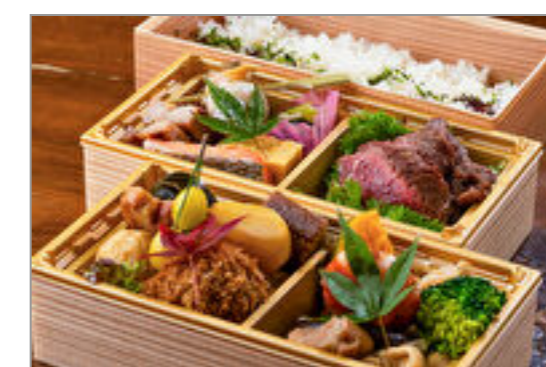
しまや 三段重 彩り弁当