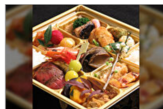
しまや 豪華絢爛和食重