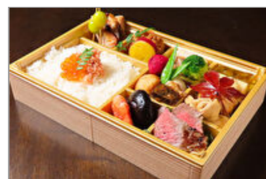
しまや季節の一段弁当