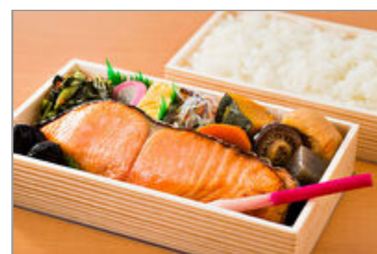
＜古町包＞復刻味噌漬銀鮭