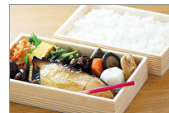
＜古町包＞復刻味噌漬銀だら