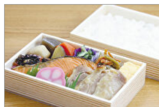
＜古町小包＞にぎわい膳

商品によっては、注文条件やオプション・サービス等がございますので、詳しくはWEBでご確認ください。