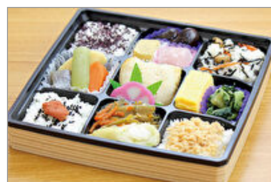
彩膳(銀だら甘粕漬)