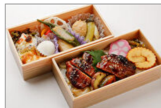
炙り鶏照り焼き御膳