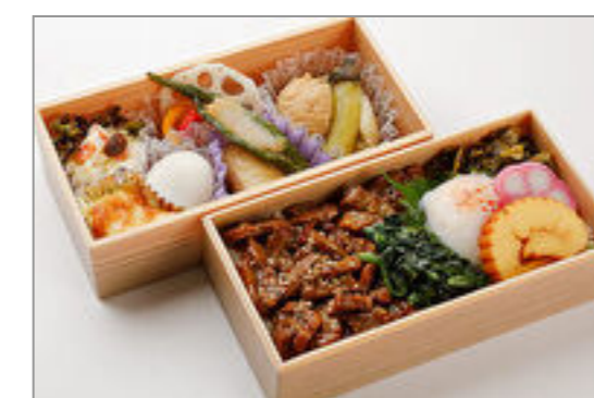
黒毛和牛の粒山椒煮御膳