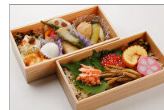
手ほぐし鮭いくら御膳