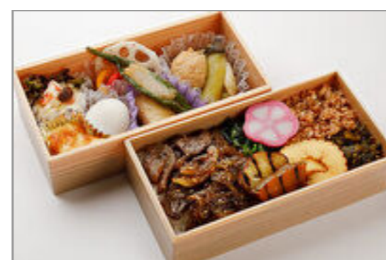
黒毛和牛の焼きしゃぶそばろ御膳