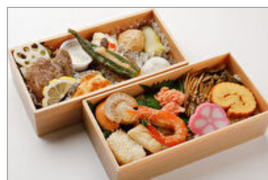
海鮮五目とローストビーフ御膳

商品によっては、注文条件やオプション・サービス等がございますので、詳しくは WEB でご確認ください。