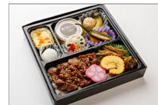
【選べる冷製スープ】黒毛和牛のしぐれ煮御膳