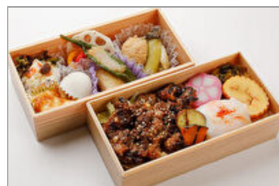
イベリコ豚の香味焼き御膳