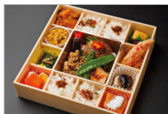
彩り花御膳一肉三味一