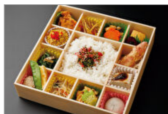
彩り花御膳一梅じゃこ一