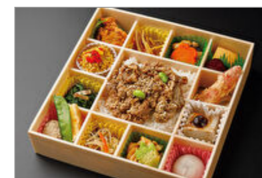
彩り花御膳一炙り豚焼肉一