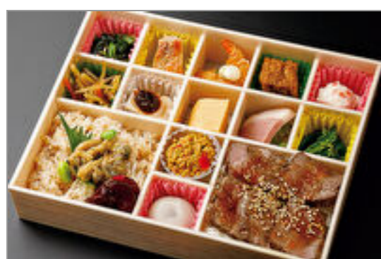
黒毛和牛ステーキと房総あさり飯の彩り懐石弁当

商品によっては、注文条件やオプション・サービス等がございますので、詳しくは WEB でご確認ください。