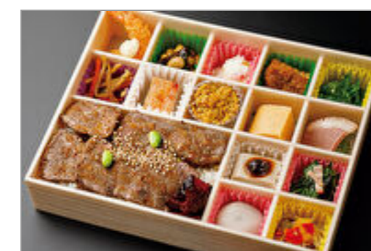
A5黒毛和牛赤身ステーキ懐石弁当