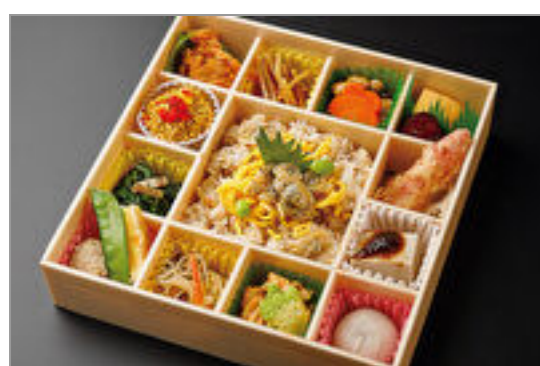
彩り花御膳一あさり飯一