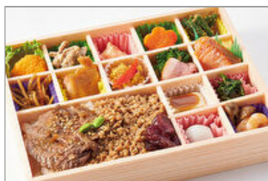
ハラミステーキと旨味そばろの肉懐石弁当