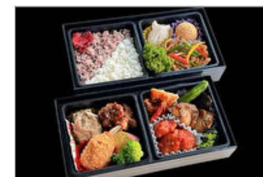
【熨斗対応可】特選中華二段重