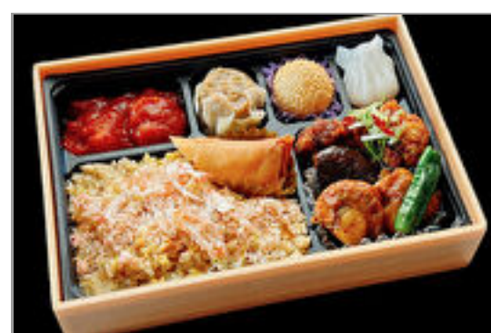
【熨斗対応可】蟹炒飯御膳