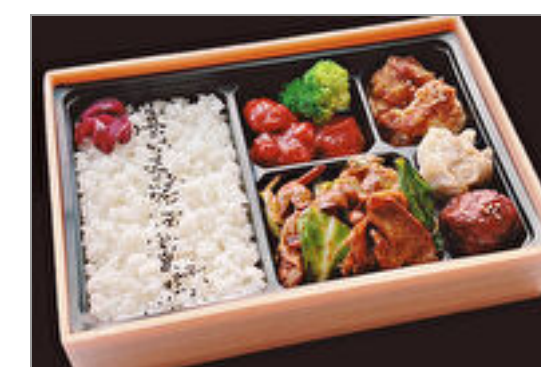
回鍋肉ホイコーロー弁当