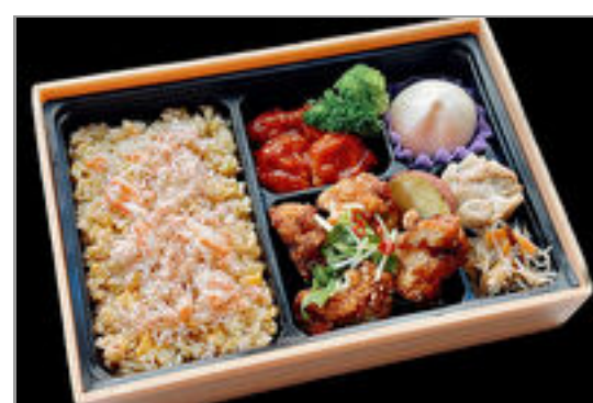
蟹炒飯と油淋鶏弁当