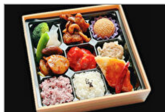
【熨斗対応可】中華弁当福膳