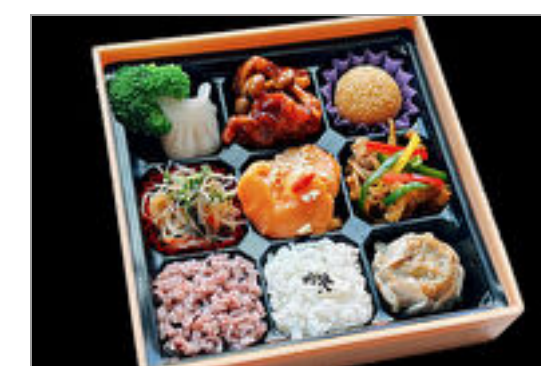
【熨斗対応可】中華弁当花膳