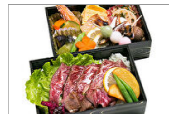
和牛ステーキ弁当