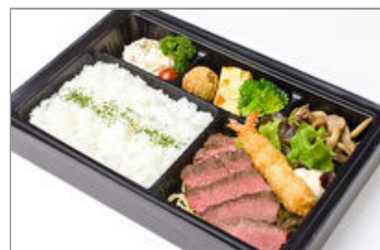
【温まる】熟成牛肉の贅沢ステーキと海老フライ弁当