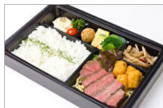
【温まる】熟成牛肉の贅沢ステーキ弁当