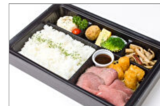
ローストビーフ弁当