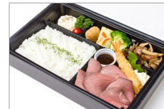
ローストビーフと海老フライ弁当