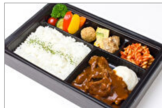
【温まる】牛肉の赤ワイン煮込み弁当