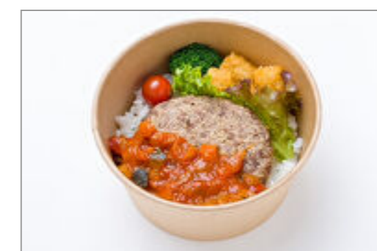
”極やわ”和牛ハンバーグラタトゥイユソース丼