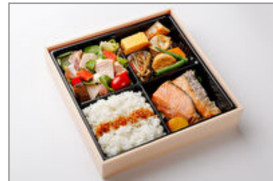
旬の彩り和食御膳