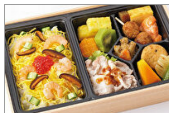
特選ちらし寿司弁当