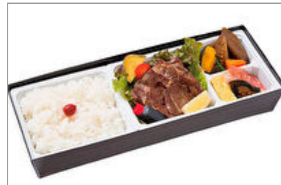
特選焼きしゃぶ弁当