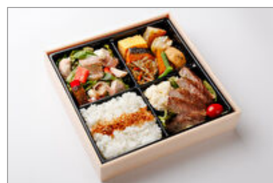
特上松花堂弁当(すき焼き)

商品によっては、注文条件やオプション・サービス等がございますので、詳しくは WEB でご確認ください。