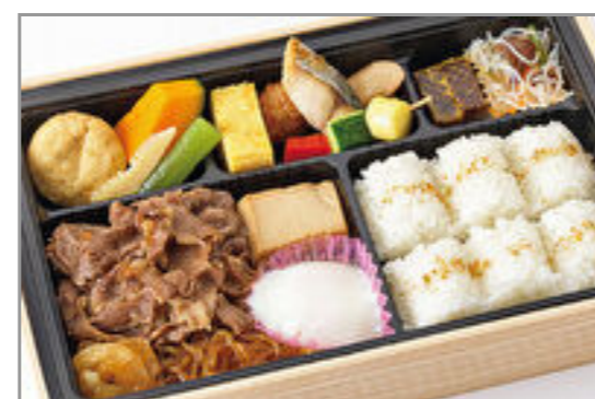
特選和牛すき焼き膳