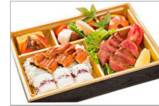
特選和牛ヒレステーキ御膳