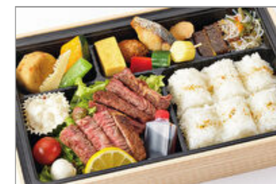
特選和牛サーロインステーキ膳