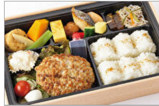
特選和牛ハンバーグ膳