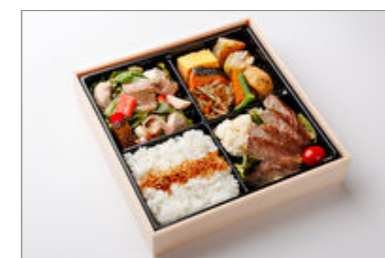
特上松花堂弁当(ローストビーフ)