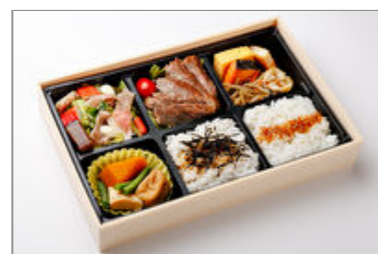
特選ふくろう弁当(ステーキ)