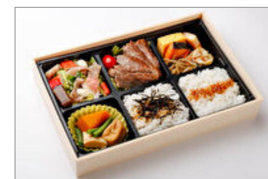
特選ふくろう弁当(ローストビーフ)