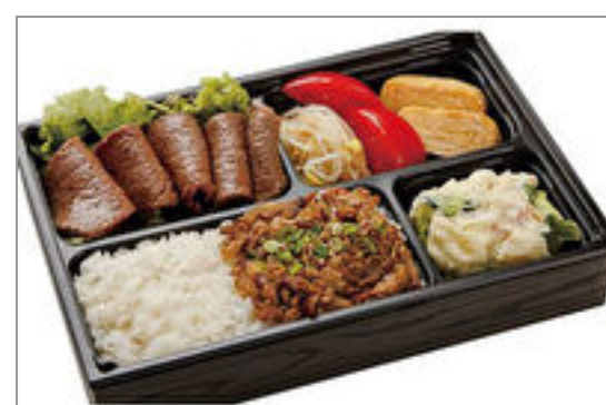
A5和牛赤身&松阪牛・神戸ビーフのしぐれ煮弁当

商品によっては、注文条件やオプション・サービス等がございますので、詳しくは WEB でご確認ください。