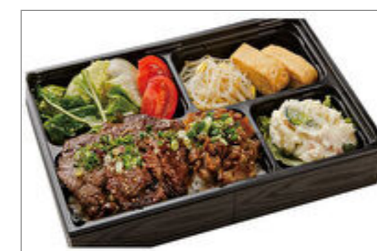
牛ロース&松阪牛・神戸ビーフのしぐれ煮弁当