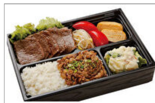
神戸ビーフ赤身&松阪牛・神戸ビーフのしぐれ煮弁当