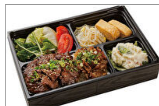
牛ハラミ&松阪牛・神戸ビーフのしぐれ煮弁当