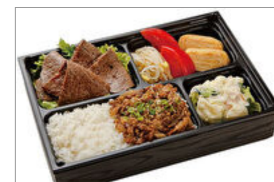
A5和牛カルビ&松阪牛・神戸ビーフのしぐれ煮弁当