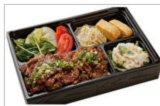
牛カルビ&松阪牛・神戸ビーフのしぐれ煮弁当