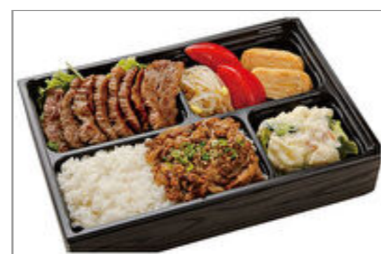
松阪牛カルビ&松阪牛・神戸ビーフのしぐれ煮弁当