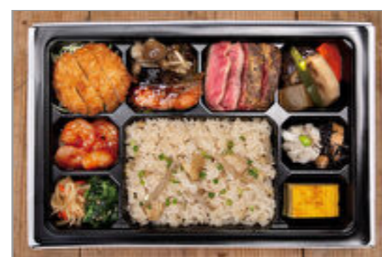
おもてなし幕の内(和・洋・中mix)