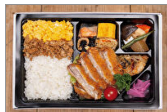
豚ロースかつ御膳