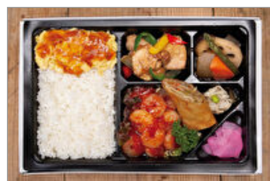
中華エビチリ幕の内