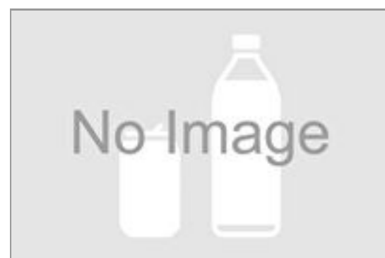
生茶(525ml ペットボトル)