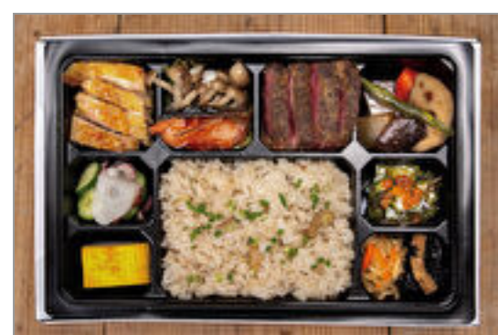
和のおもてなし幕の内

商品によっては、注文条件やオプション・サービス等がございますので、詳しくは WEB でご確認ください。