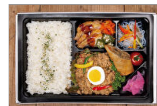
亜細亜エスニック幕の内