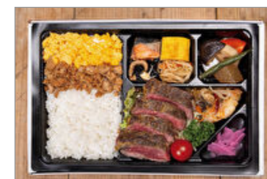
牛赤身ステーキ御膳