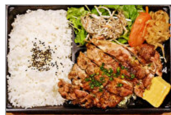
炭焼きチキンステーキ弁当