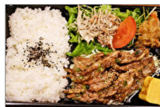
炭焼き鶏セセリねぎ塩弁当