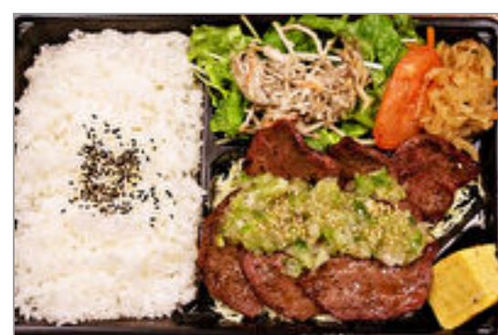
ネギ塩牛タン弁当

商品によっては、注文条件やオプション・サービス等がございますので、詳しくはWEBでご確認ください。