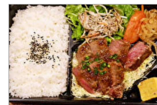
牛ステーキ弁当～和風ソース～