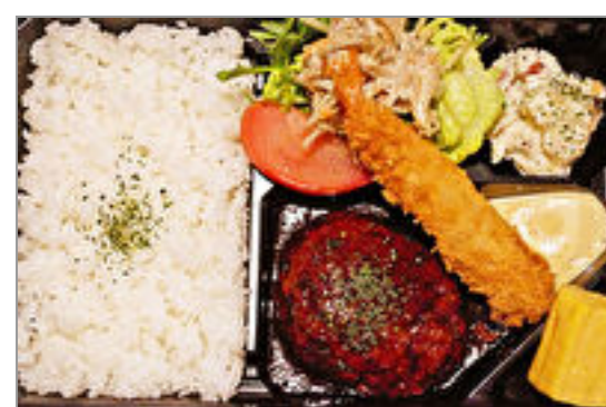
ハンバーグ&エビフライ弁当