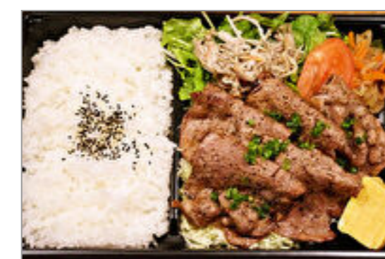
炭焼き道産豚肩ロース弁当